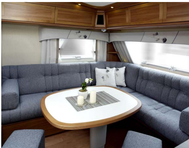
L-soffa i flera modeller.

När Royal 560 LXL, med vinkelsittgrupp i fronten, introducerades för ett år sedan blev den snabbt en succé och flera andra vagnsstorlekar har på specialvagnsverkstaden under det gångna året inretts med samma sittgrupp. Till modellåret 2011 presenteras därför tre nya modeller med denna populära sittgrupp: 590 LXL, 610 LDXL och 720 LUTDL – samtliga i Royal-utförande. Med L-soffan får man plats med en stor TV och man får flera förvaringsutrymmen. Samtliga L-soffor är även nedbäddningsbara.