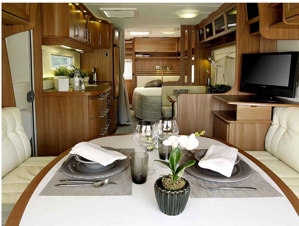
Interiör KABE 2011.