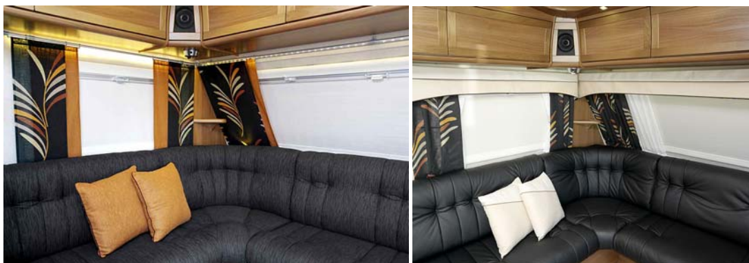
Panelgardiner på gardinstång med belysning - mer traditionell upphängning med kapp.