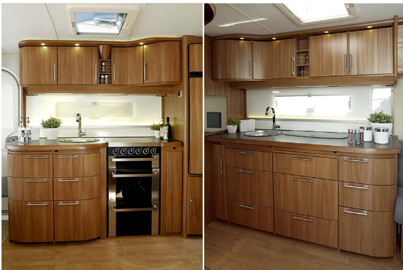
Nydesignade kök - Royalkök med stora spisen med ugn till vänster och Ädelstensköket till höger.

I samtliga vagnar används ett laminat i ny färg på arbetsbänken, samma material finns även som täcklock till diskhon. Ett nytt stänk- och värmeskydd av rökfärgat glas förstärker ytterligare det eleganta intrycket. Även laminatet på matbordet är nytt, med en kant av massivt trä. Alla lådor är försedda med soft-close och centrallås.