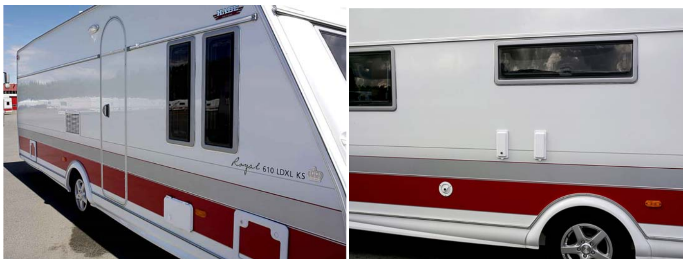
Slät plåt som tillval.

De vagnar som beställs med slät ytterplåt får dessutom en diskret kromlist runt fönstren, som ytterligare förstärker elegansen.