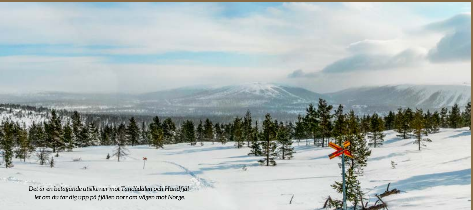
Det är en betagande utsikt ner mot Tandådalen och Hundfjället om du tar dig upp på fjällen norr om vägen mot Norge.

annorlunda. Det kan naturligtvis kännas svårt att hantera en 2,5 meter bred vagn i trafiken, men den upplevelsen kompenseras med råge av rymdkänslan när vi vistas i vagnen.