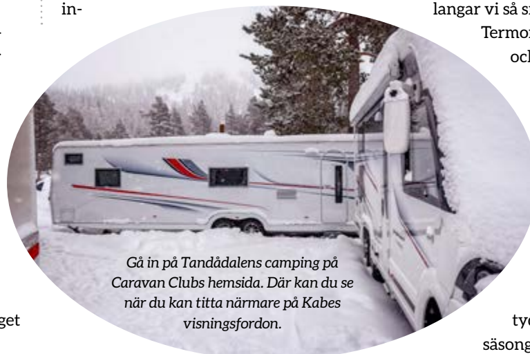
Gå in på Tandådalen camping på Caravan Clubs hemsida. Där kan du se när du kan titta närmare på Kabes visningsfordon.

Redan här blir det väldigt tydligt för oss varför de som säsongscampar hellre har husvagn