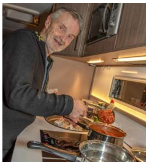
Kabe har alltid satsat mycket på kök som är både praktiska och välutrustade. Här finns allt och det är enkelt att fixa mat till många gäster tack vare både induktions- och gasolspis.

Den husvagn vi provbor är av 2017 års modell. Grundpriset, när den var ny, låg klart över en miljon kronor, så det är frestande att dra paralleller till husbilar på samma prisnivå. Men vi konstaterar snabbt att det blir lite som att jämföra äpplen och päron. Fordon i den prisklassen är normalt