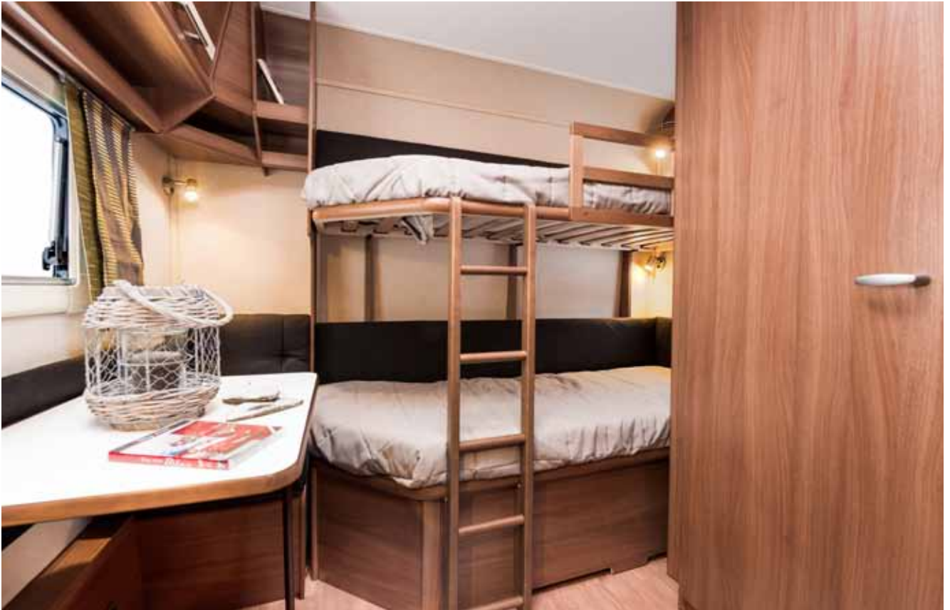
Barneromsdelen i Classic 660 GDL kan du velge mellom to eller tre køyesenger.