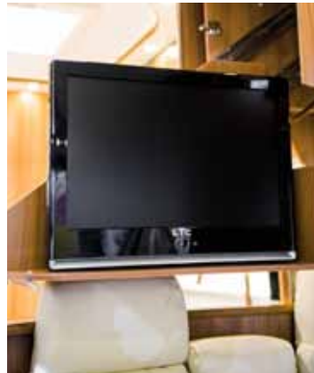
Innskyvbart feste for TV.