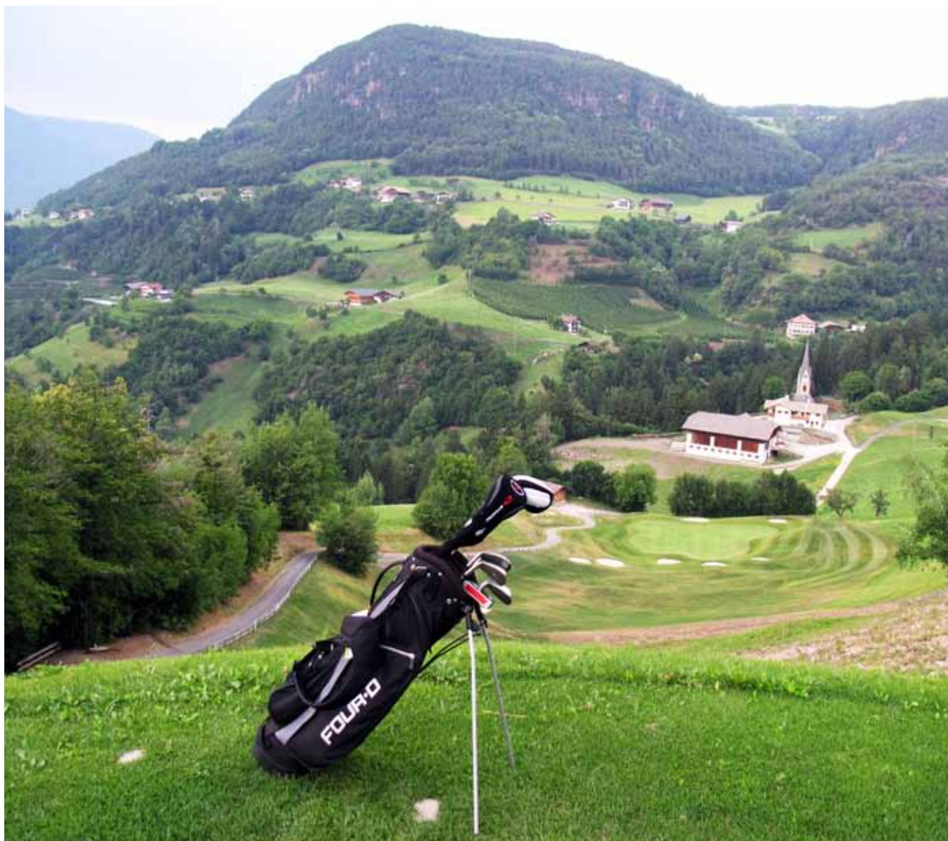
Hull 15 på Kastelruth GC.

Det følte storslagent å gå rundt med golfbagen på ryggen omgitt av 3000 meter høye fjell. De 18 hullene er forsiktig innplassert i landskapet og på enkelte steder hadde det ikke