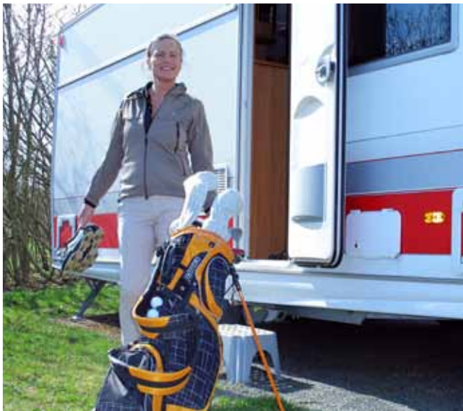
Kastelruth GC – nabo med campingen.