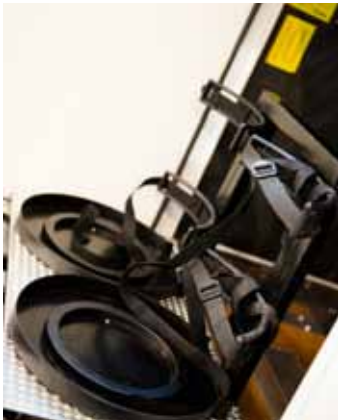
Uttrekkbar "vogn" for gass.