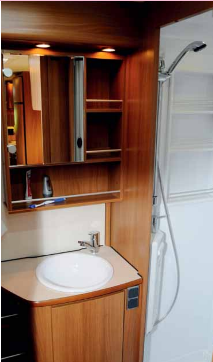
KABIN. Stort toalettutrymme med separat duschkabin är uppskattat och till vänster utanför bild finns en garderob.