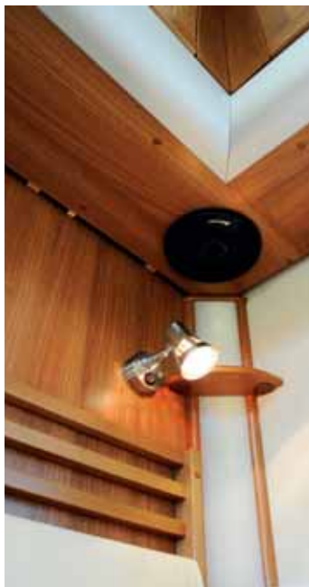
LJUD. Pioneer högtalare i både bildel och bodel vid sängen.

HYGIENUTRYMMET HAR separat duschkabin och en finurlig garderob, näbar även utifrån, samt toalettstol med vridbar porslinsstol. Även här finns god belysning, 230-volts uttag, bra toalettstol med förvaring, och ett runt handfat i plast med en snygg