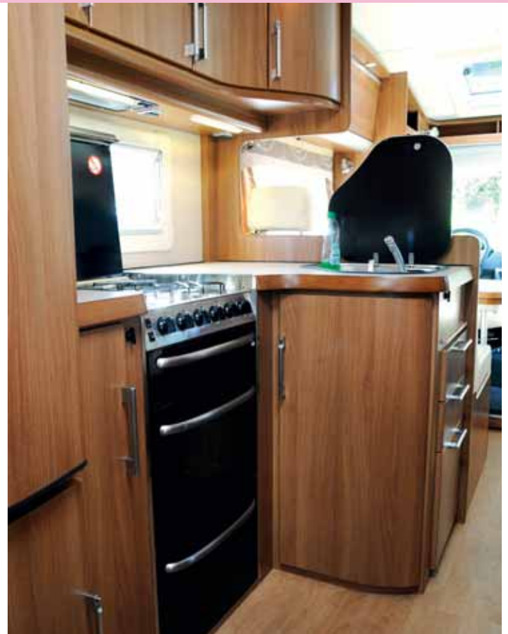
VINKLAT. Det stora köket i vinkel har lådor i en sektion som kan nås från sittgruppen. Rejäl ugn med grillfunktion och fyrårig spis.

Väl inne i bilen är trivselfaktorn hög, precis innanför entrédörren finns en liten hänggarderob för jackor på galge, plus fyra starka krokar på