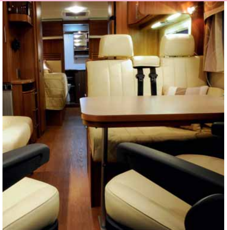
LÅNG. Sittgruppen rymmer sju personer och matbordet kan förlängas med en utdragsskiva. Bältesstativet i bild är höjbart.