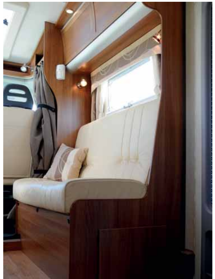
VINTERSKYDD. Draperiet skyddar mot kyla men är aningen klumpigt att handskas med när det ska dras för.