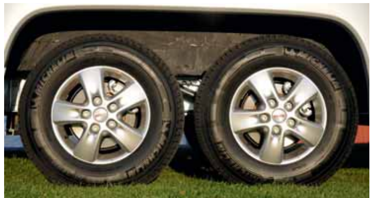
TANDEM. Dubbla bakhjul med lättmetallfälgar sväljer fartguppen och ger stadig gång även i högre farter.