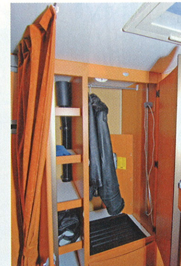
Kaben pystyvaatekaappi on talvikäyttöön suunniteltu: kuivauskaukalo, valaistus, tuuletus sekä lämmitys löytyvät. Pystykaapin vieressä on kapea hyllykaappi, ja makuuhuoneen väliverho on sopivan kevyt sekä tilaa viemätön kankainen.

Lämmityksen ja tuuletuksen lisähienouksia ovat lämpösolat kaappien takaseinissä, säädettävä raitisilman sisäänvalo ja solifermainen tuuletusluukku. Pehmustettu katto eristää ja vaimentaa sateen ropinaa kattoon. Alden meluongelmia ei esiintynyt.