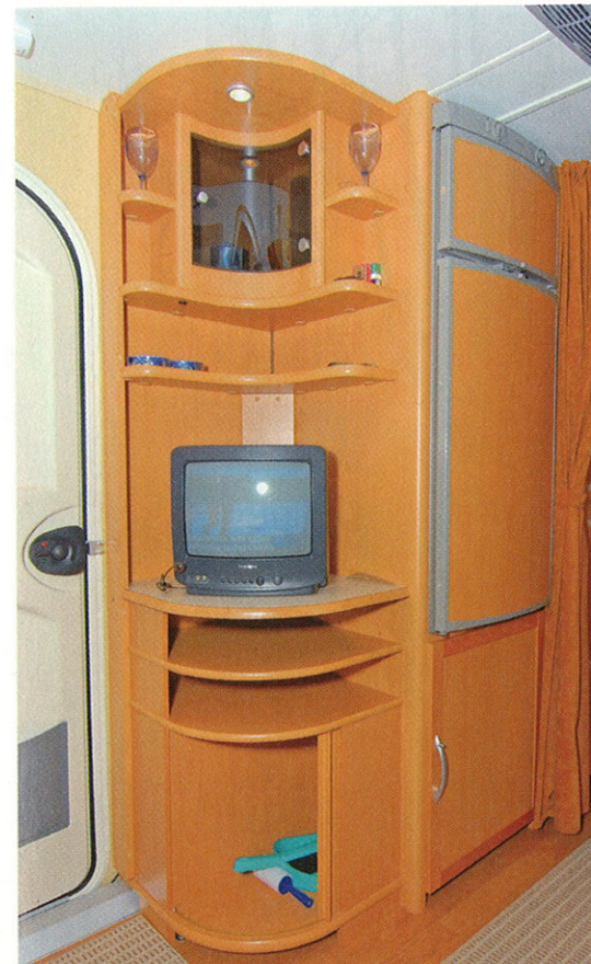
Television ykköspaikka on ulko-oven vieressä ja katselu sohvalta onnistuu hyvin. Digisoittimen tai DVD-soittimen saa helposti alahyllylle, ja ylin lasiovikaappi on baari-kaappi. Alakaapit ovat puolestaan normaalia korkeampia, ja suuri erillisellä pakastinosalla varustettu jääkaappi on näin sopivalla työkentelykorkeudella.

Joulukuun myrskyisät nollakelit eivät ole ruotsalaiselle vaunulle mikään vaikea sää; Kaben lämmityksestä vastaa vesikiertoinen Alde lattialämmöllä. Huurtumista ei esiintynyt, ja lämpö oli tasainen myös lattialla sekä monesti vaikeassa kulmavessassa.