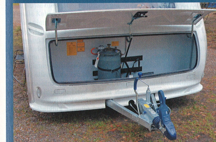
Kaasupullokotelo on tilava ja tiivis, mutta aisapaino ei salli kahta rautapulloa tai ylimääräistä lastia. Winterhoffin kitkavetopää on helppokäyttöinen, ja 13-napainen pistoke sallii kaikki sähkötoiminnot.

Etusohvan alla on valaistu vaunun levyinen ja kaukalollinen suksiluukku. Leiriytymistä helpottaa kulmatukien veivinkohtien sijoittaminen vaunun sivulle: näin ne löytyvät myös pimeässä tapuilematta tai kumartelematta.