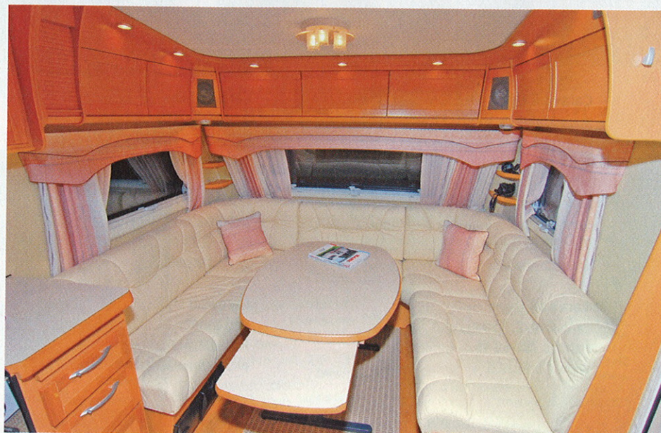
Kabe Royal 560 on Suomen suosituin Kabe. Se on myös sekä sisustukseltaan että kooltaan suosituimmassa luokassa. Alumiinivanteet kuuluvat vakiovarusteluun, koeajossa alla oli nastarenkaat peltivanteilla ja -kapseleilla.

Sohvan istumakorkeus on hieman normaalia korkeampi, vaikkakaan siitä ei ole mitään haittaa. Materiaalina nahka on miellyttävä ja sopii parhaan mallisarjan