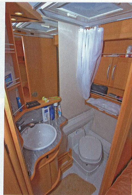
Vessa on melko ahdas, eikä missään nimessä riittävä suihkun ottamiseen. Liukuovi pelastaa tosin hieman tilannetta, mutta pyyhkeille ei ole kuivatustelinettä eikä koukkuja. Kaappitilaa on runsaasti, tosin syvyyttä kaipaisi hieman lisää.