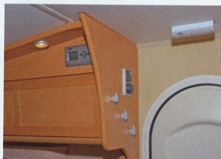
Alden lämmityksen säätöpaneeli on oven suussa, ja varashälytin pitää kutsumattomat vieraat loitolla. Vaatekoukut ja päävalokytkimet ovat nekin käsillä heti vaunuun tultaessa.

etupäässä. Kenkäkaappi on oven pielessä, ja televisiokaapin päällä on lasiovellinen konjakkipullokaappi. Kaappien ovien lukitukset ovat hyvin toimivia ja tukevan tuntuisia. 40 litran raikasvesisäiliö on etupäässä ja pieni 15 litran harmaa-vesisäiliö sängyn alla. Putkistot on sijoitettu lämpöpattereiden päälle, ja tyhjennyskanat ovat hyvin esillä. Pistorasioita on yhteensä seitsemän, mikä on juuri riittävä määrä nykyaikana tämän tason vaunuun.