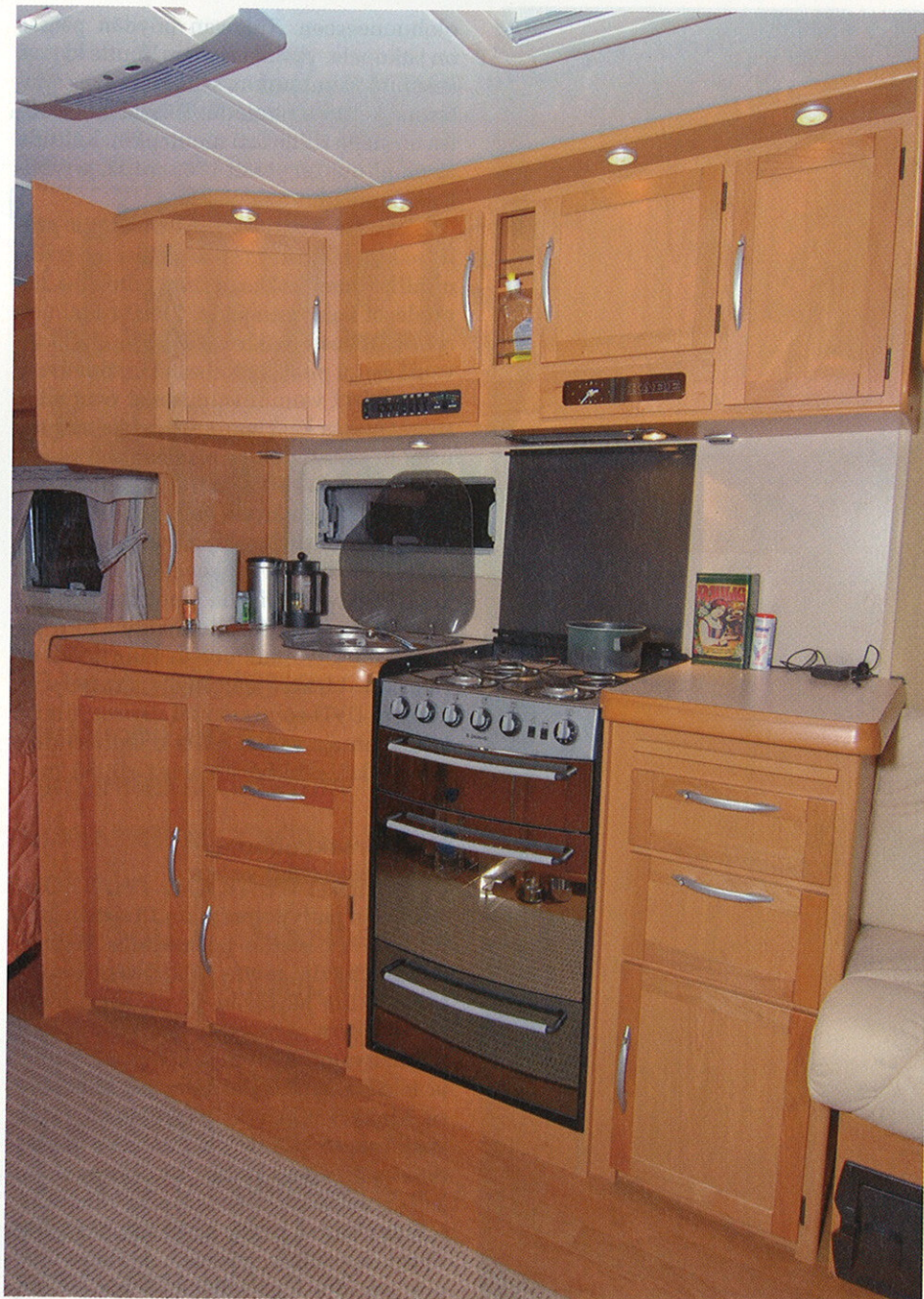
Keittiössä on työtilaa ja kaappeja yllin kyllin. Neliliekkinen liesi ja uuni kuuluvat vakiovarustukseen, joten mahdollisuudet kunnan aterian valmistukseen ovat mainiot.