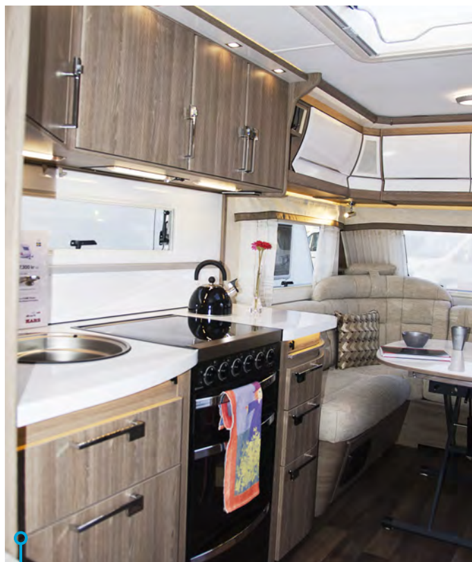
Ett kök som inte lämnar mycket övrigt att önska.

I KÖKET , som också har högblanka vita ytor, liksom bordet och skåpfronterna, tronar en fyrårig spis med ugn. Vagnen har en köksbänk med plats för matberedning, sex lådor och rymliga överskåp. Fönsterväggen är klädd i vitt plexiglas. Lådorna har soft close och centrallås.