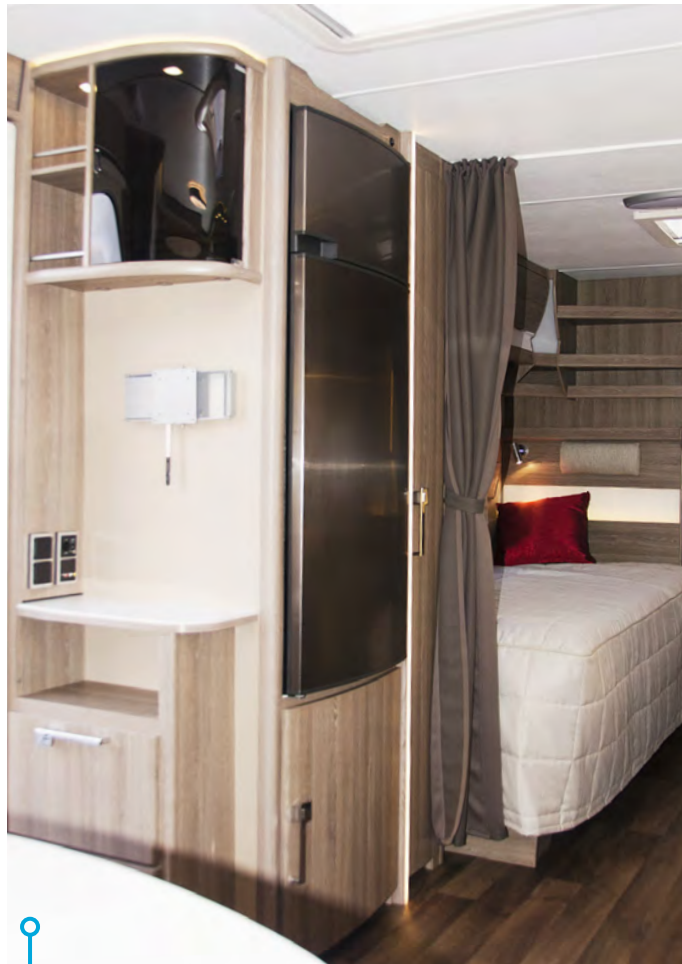
En genomarbetad möbelmodul som på liten golvyta erbjuder både vitrin, garderob, kyl, skofack och annat.

underlättar för bakomvarande trafik att upptäcka att vagnen bromsas även om det ligger en bil mellan och skymmer de lägre ordinarie bromsljus. Bak, front och sidor är utförda i slät aluminium, en led-list på vagnens entrésida lyser upp under markisen eller i förtältet om man föredrar det.