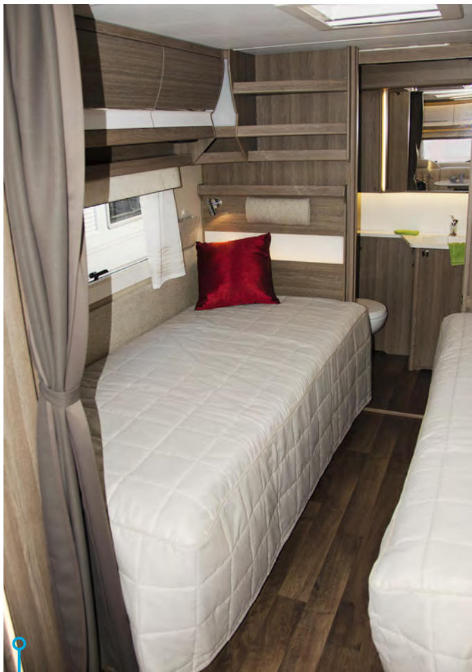
Den ena sängen är tio centimeter längre än den andra. Sovdelen kan skämmas av med draperi.

Sovrummet med sina två singelbäddar börjar efter köket och den ganska smala garderoben mitt emot köket. Det går att skärma av med ett draperi, men eftersom toaletten ligger längst bak i vagnen via sovrumsrummet, så föreställer vi oss att avskärmningen sällan eller aldrig kommer att användas. Möjligen om paret vagnen är tänkt för har olika dygnsrytm. Den ena bädden är något kortare än den andra, vilket kan ses som en fingervisning om att Kabes husvagnar byggs för par där den ena är kvinna - om ni ursäktar genusperspektivet.