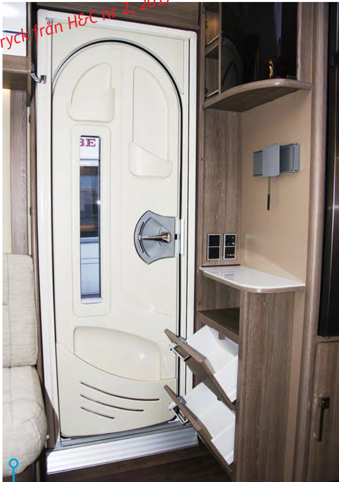
Entré dörren med större bredd, fönster och inbyggt myggnät i Kabe Royal.