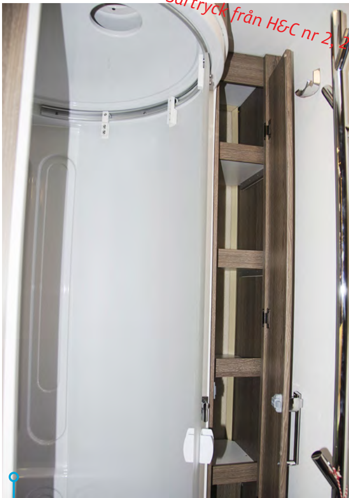
Denna vagn har naturligtvis en separat duschkabin. Hela tvättrummet andas funktionalitet.

VÄRMEN I VAGNEN kommer från varmt vatten i element, som i sin tur värms av el eller gasol i en Aldepanna. Ventilationen sker via öppningsbara fönster förstås, men också via Kabes patenterade ventilationssystem. Det är konstruerat så att inkommande friskluft passerar varma elementkonvektorer och stiger upp längs ytterväggarna, bakom överskåpen som har därtill anpassade luftspalter. Tack vare manuellt justerbar öppning på inkommande luft kan man anpassa cirkulationen efter omständig-