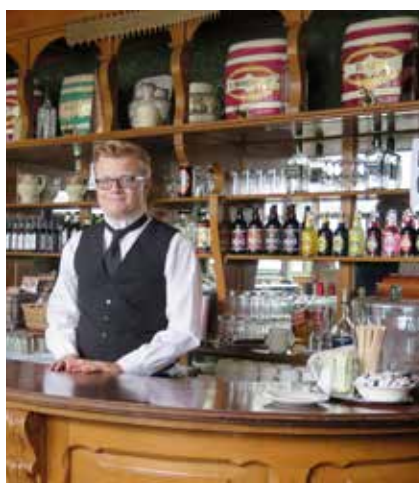
Pubben i Beamish