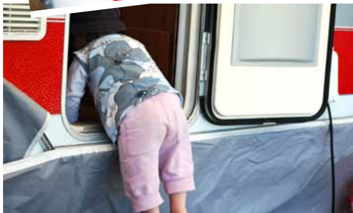
OVAN: Barnbarn på besök TILL HÖGER: Camping på golfbanan, Hökensås