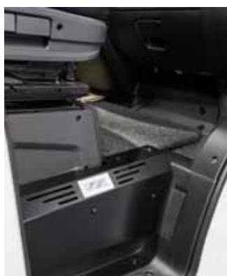
Hytt med värmekonvektorer för instegen – på bägge sidor.