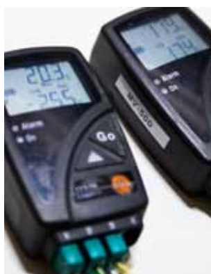
90 graders temperaturskillnad: det ska vara lika behagligt i vagnen både när det är -35^{\circ}\text{C} och +55^{\circ}\text{C} .