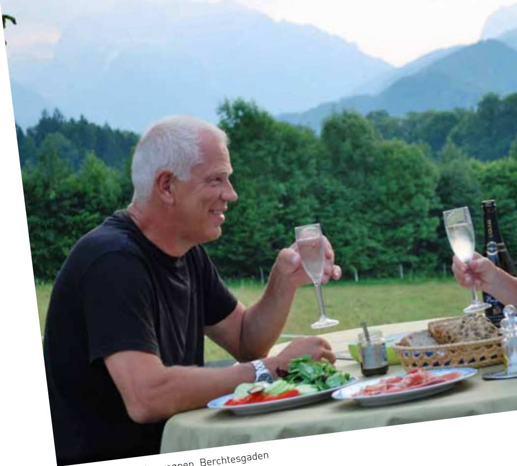
Kvällsmys utanför husvagnen, Berchtesgaden

Vi badade, solade och kopplade av. En förmiddag åkte vi till Sirmione, en medeltida stad med smala gränder som ligger på en halvö. Allra längst ut finns ruinerna av ett romerskt palats. På onsdagen gick vi på marknad i Lasize. Nästa dag spelade vi golf. Plötsligt hade det gått en hel vecka och vi hade fortfarande ingen aning om vart vi skulle åka.