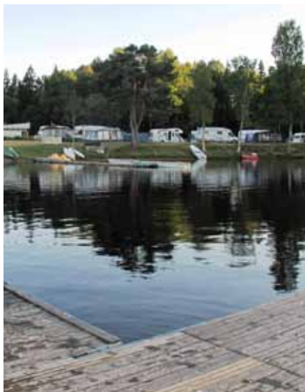
Stilla kväll på Motala camping