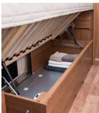
Sänglådorna är modifierade för att det inte ska påverka komforten.