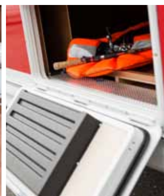
Den nya utvändiga lastluckan har värmeslingor runt hela luckan och luftkanaler.

Varje nyhet och förändring vi gör får konsekvenser, därför provas allt ytterst noggrant i vår välutvecklade testanläggning, innan det förs in i den löpande produktionen.