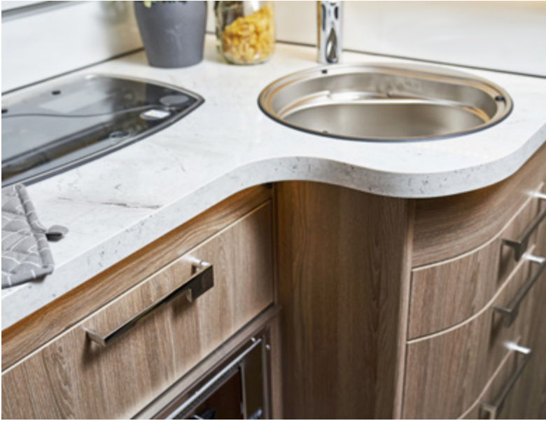
Upotetut ovet ja laatikot.