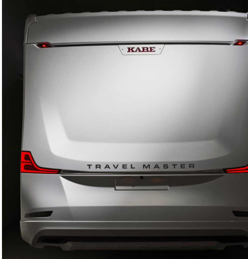
Uusi takapäätty puoli-integroiduissa Royal-matkailuautoissa