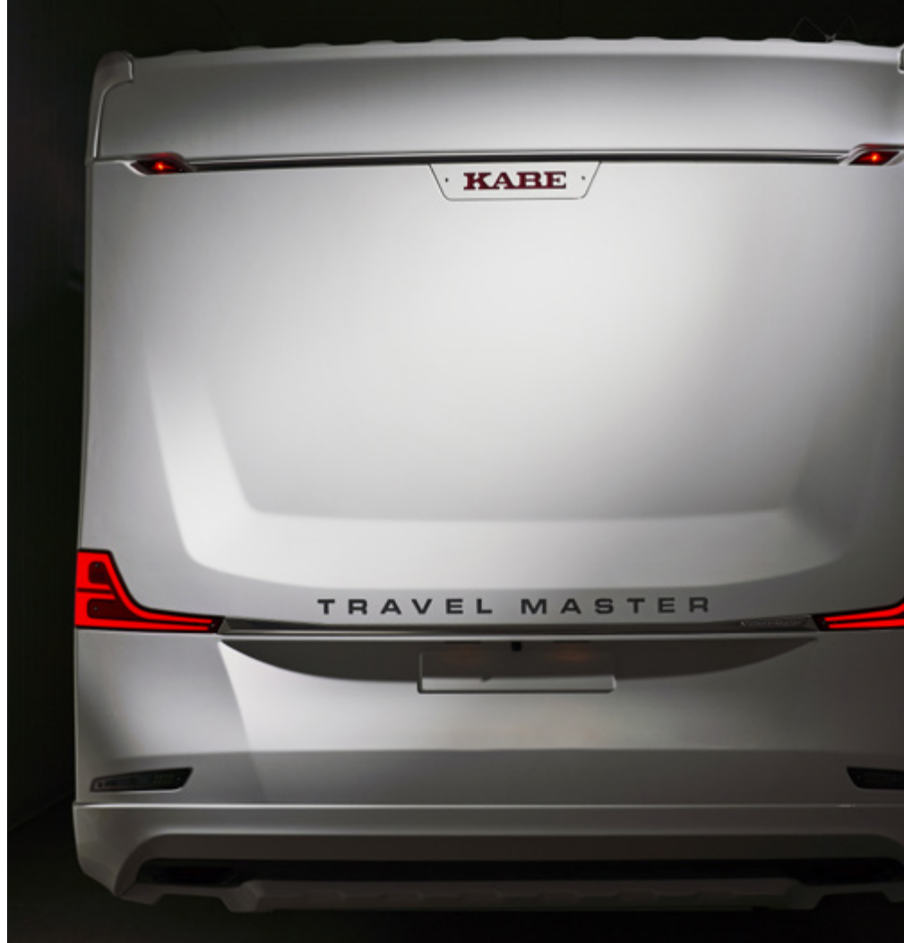
Neues Heck der teilintegrierten Royal-Wohnmobile.

die Funktionen der KABE Smart D-Bedientafel steuert. Die Temperatur in Kühlschrank und Gefrierfach werden mit Hilfe eines Sensorsystems überwacht, was auch zu einem gesenkten Energieverbrauch beiträgt“ erläutert Mikael Blomqvist.