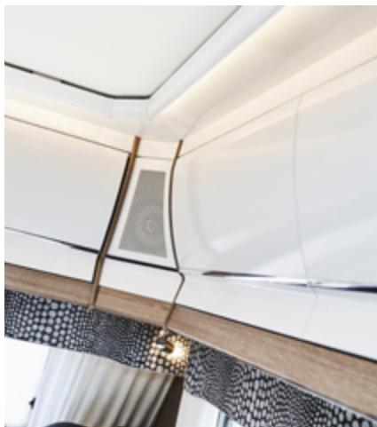
Deuren van de bovenkasten, chroomlijst, hoogglans Shannon Oak.