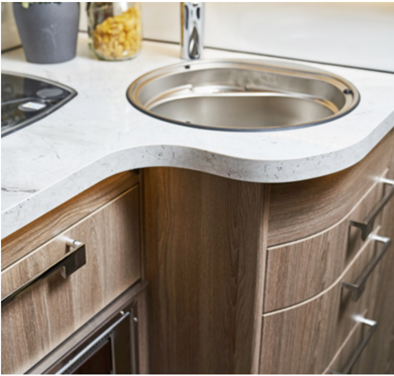
Verzonken laden en deuren.