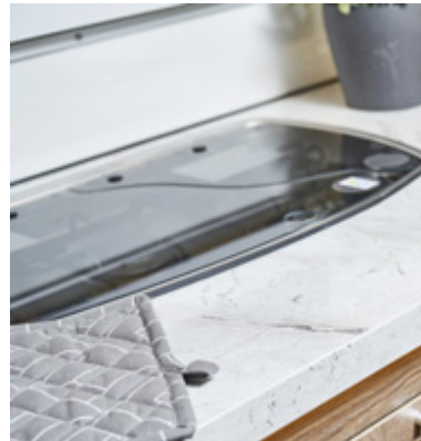
Laminaat "marmere" op het werkblad.