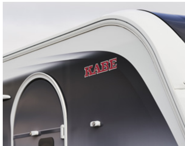
Nieuw decor op de vlakke wandbeplating met stijlvolle lijnen en sobere donkere tinten.

U bent altijd verzekerd van de unieke waarden van KABE, welk model u ook kiest om helemaal te voldoen aan de behoeften van u en uw gezin.