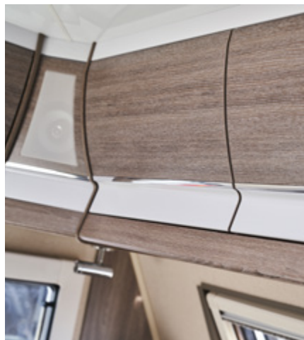
Deuren van de bovenkasten, chroomlijst, Shannon Oak.