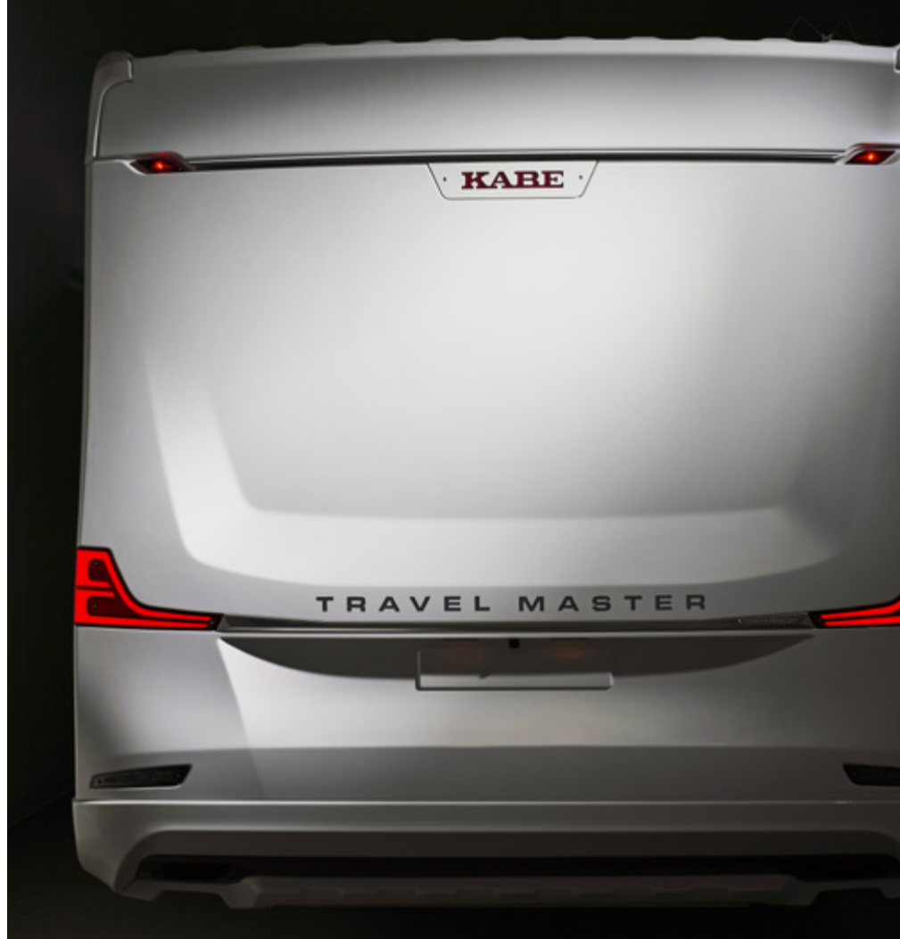
Nieuwe achterzijde voor de halfgeïntegreerde Royal-campers