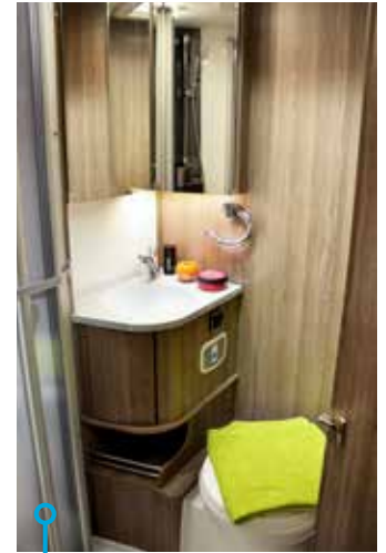
Hygienutrymme med bra förvaringsutrymmen och duschfunktion.