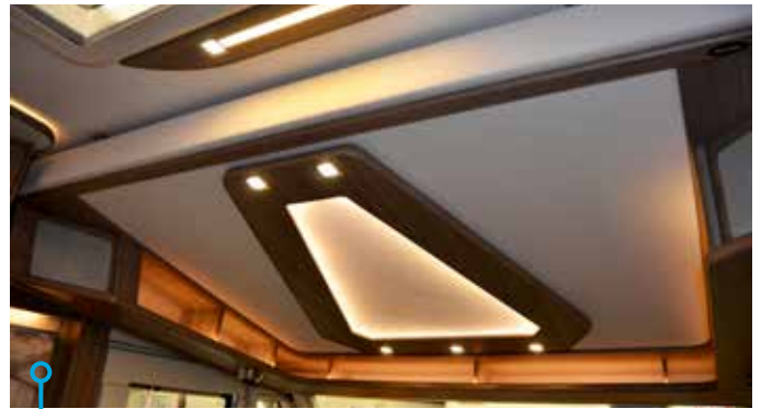
Bra belysning och massvis med fack i taksängens underrede. 200 kilo är maxbelastningen.

Överskåpen är av hög kvalitet, de öppnas och stängs både mjukt och följsamt. Fast bäst av allt är väl att en Kabehusbil fungerar som en termos. Den håller mjölkchokladen het en kylig vinterdag vid pulkabacken samtidigt som den bibehåller apelsinsaftens svalka en het sommardag vid stranden.