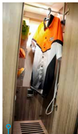
Garderob med belysning, takventil och droppskål.