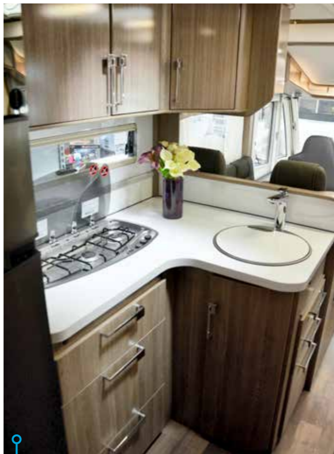
Elegant, robust och funktionellt vinkelkök.

SKÅP OCH MÖBLER har inbyggda luftspalter så att luften kan cirkulera fritt medan elkablar, vatten- och avloppsslangar är inpaketerade i uppvärmda kabelrännor. Egen konstruktion är det även på fönstren (typ K D-Lux). Här gäller så kallade energifönster med inbyggd