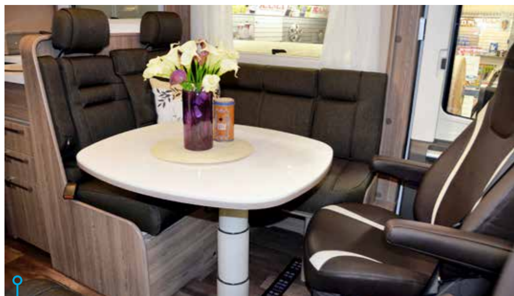
Mörk och oöm klädsel. Dessutom bra sittkomfort runt om teleskopbordet.