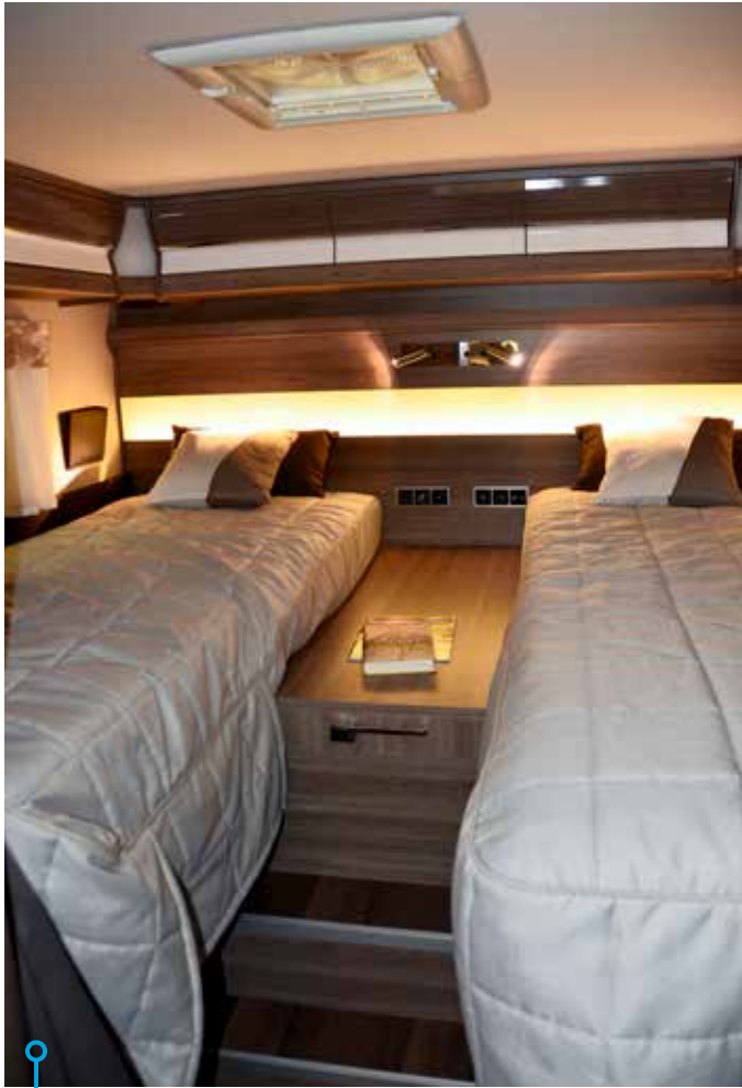
Kvaliteten på sängarna är hög med bland annat tjocka bäddmadrasser. Notera även turbo-vent i taket.

ventilation och polyuretankarm som tätar mot dubbelglaset. Stort batteri (110Ah) och en generator på 200 A finns också på plats.