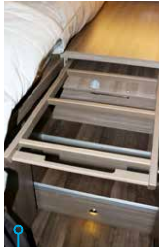
Utdragbar bäddbreddare gör att två enkelbäddar snabbt blir dubbelsäng.

LÄGG TILL MARKNADENS kanske coolaste taksäng (max 200 kg), som dessutom är praktisk då en mängd fack finns i dess underrede riktat mot bodelen.