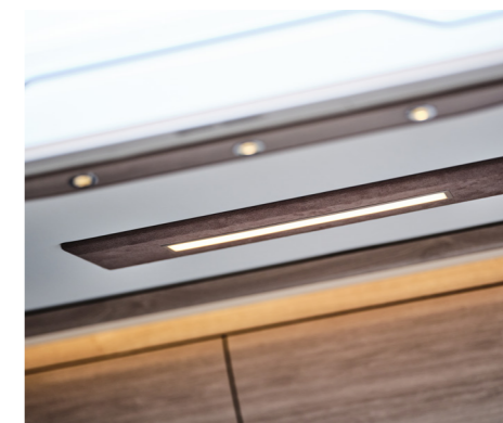
Ny taklampa, klädd i mockaimitation.