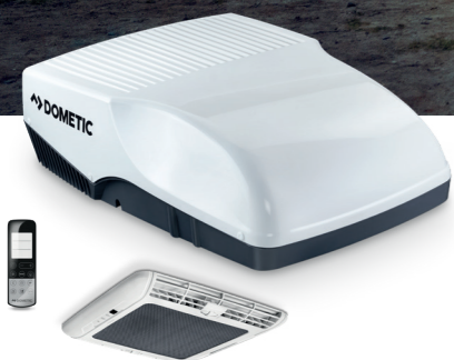
DOMETIC FRESHJET 2200