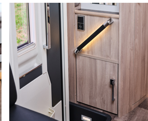
Belysning som tänds vid upplåsning av bodelsdörren.