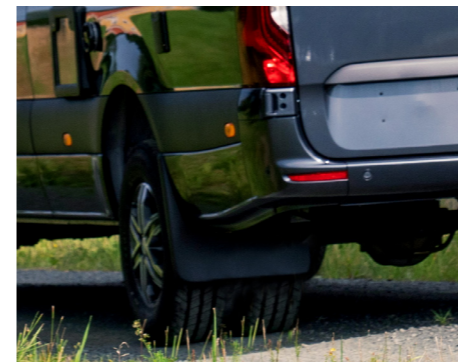
Nytt för 2022 är att du kan beställa din Van med tvillinghjul och därmed öka lastvikten med ca 850 kilo och få en tillåten tågvikt på 7 ton.