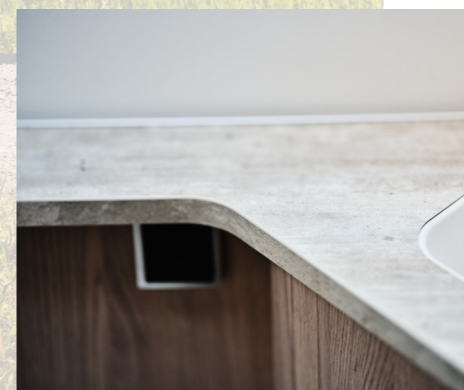
Nytt laminat, "betong-look", på badrumsbänkskiva.

– Vi upplever att KABE står väl rustade inför 2022 och att vi har utvecklat ett bra och genomtänkt modellprogram med stora valmöjligheter, som motsvarar våra kunders önskemål, konstaterar Patrik Trofast.