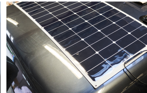
AC och solcell blir möjligt i kombination som tillval med hjälp av en ny solpanel.