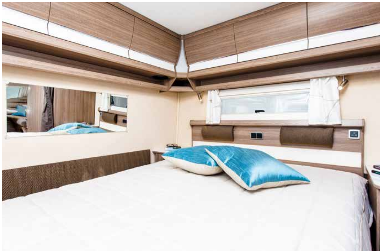
Royal 560 GLE med den nye B16-planløsningen.