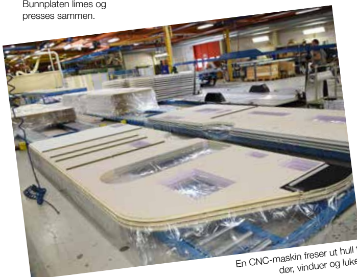
En CNC-maskin freser ut hull til dør, vinduer og luker.