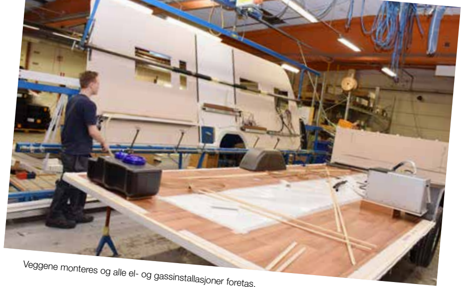
Veggene monteres og alle el- og gassinstallasjoner foretas.

Hver dag forlater cirka 7 campingvogner KABE-fabrikken i Tenhult. Drøye 1400 vogner per år leveres til kjøpere i hele Norden samt Tyskland og Holland.