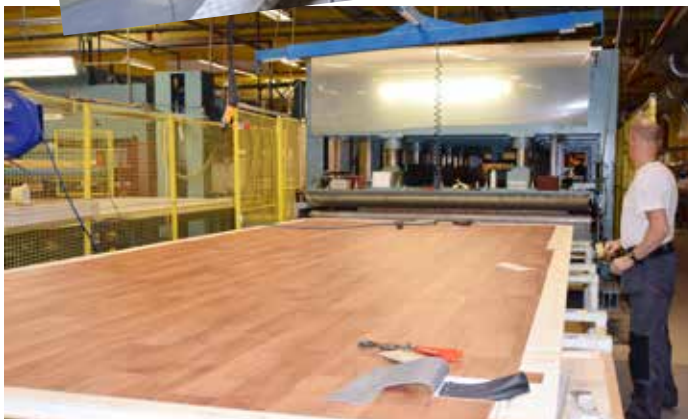
Bunnplaten limes og presses sammen.