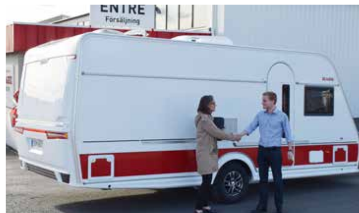
Forhandleren går gjennom alle funksjoner sammen med kjøperen og campingvognen er klar for levering.