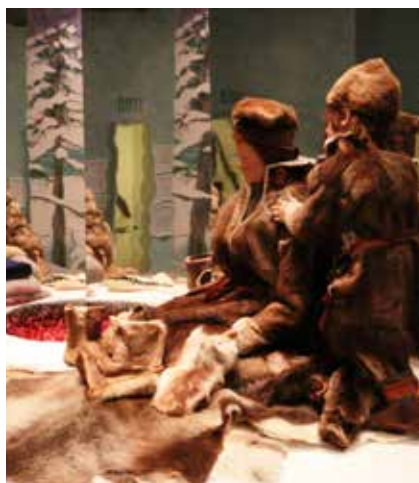
Fjell- og samemuseet.