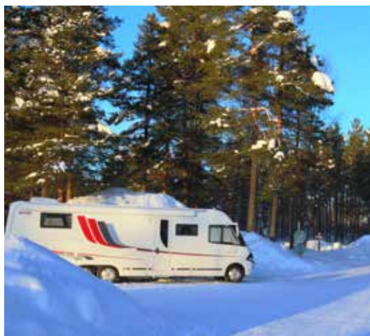
Bobilen på Arctic camp i Jokkmokk.