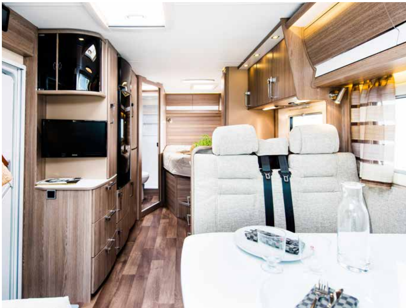
Luftig planløsning i nye Travel Master Classic 740 LXL med dobbeltseng og praktisk vinkelkjøkken.

underskapets luker skjuler seg hyller til praktisk oppbevaring. I dusjkabinens vegg finns innfelte hyller for shampo-flasker og annet.