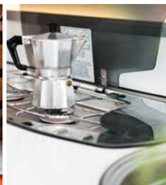
Delt lokk på den 3-bluss komfyren

- Vi har også gjort en forbedring av vår såkalte Grand Lit-løsning, den ekstra store sengen som skapes mellom to enkeltssenger. Den er nå utstyrt med en uttrekkbar sengedel som utgår fra sengebordet, forklarer Mikael Blomqvist.