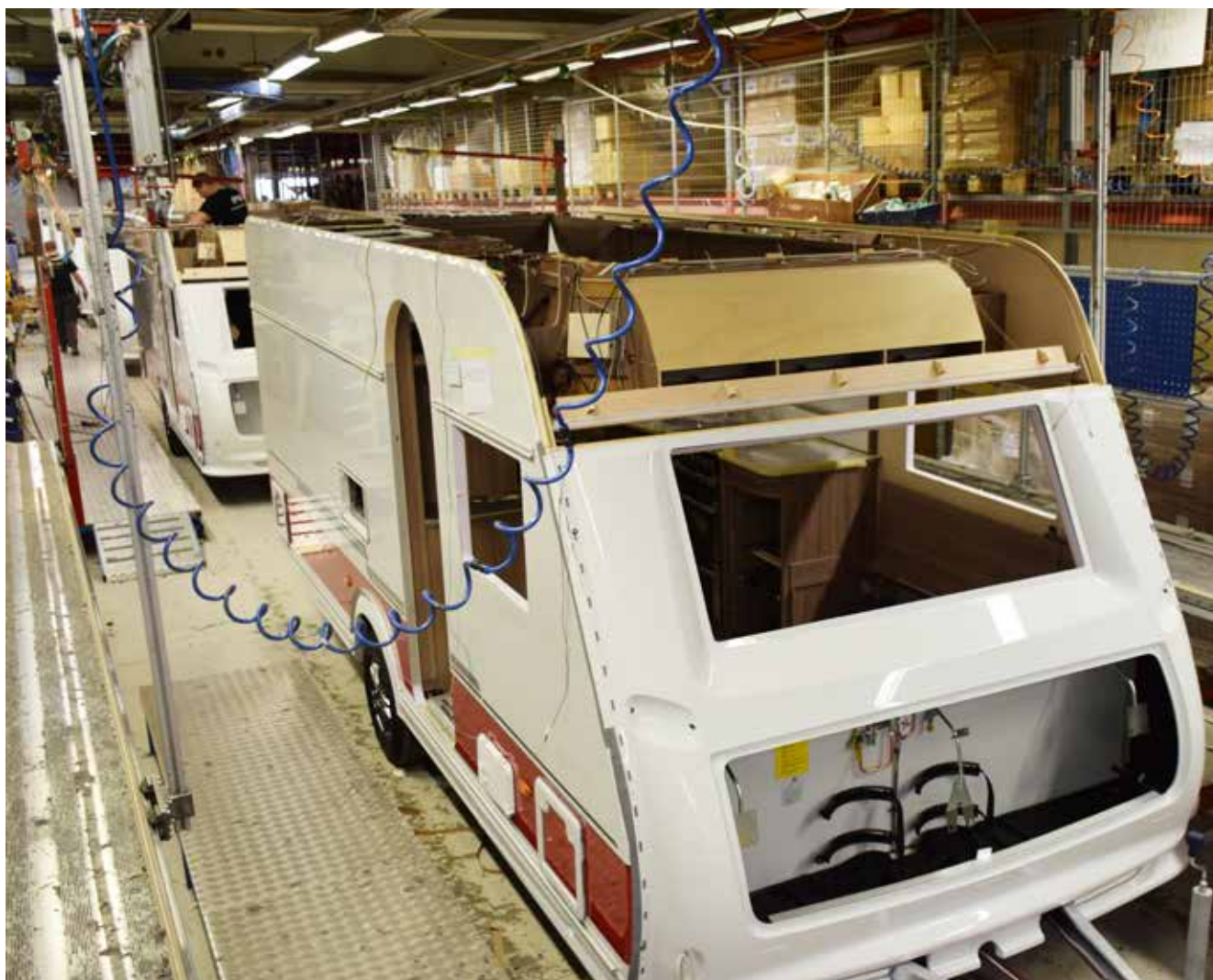
Campingvogn på den 125 meter lange motoriserte produksjonslinjen der den passerer 11 ulike arbeidsstasjoner.

Nå gjenstår "mykvarene" i form av spiral madrass og overmadrass, puter til sofaene, gardiner, installasjon av lyd- og media, innkobling av AC med mer. De siste utvendige dekkdetaljene monteres på den slette caravanplaten og en ny KABE skal snart rulle ut fra fabrikkens. Men først gjøres nøyaktige funksjonskontroller, en avsluttende