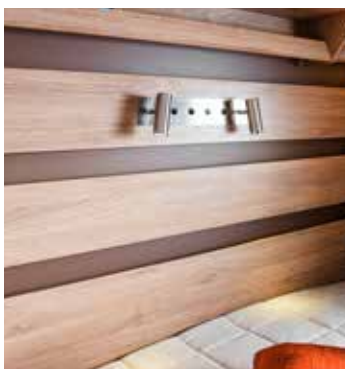
Belyst sengogavl (Classic og Edelsten)