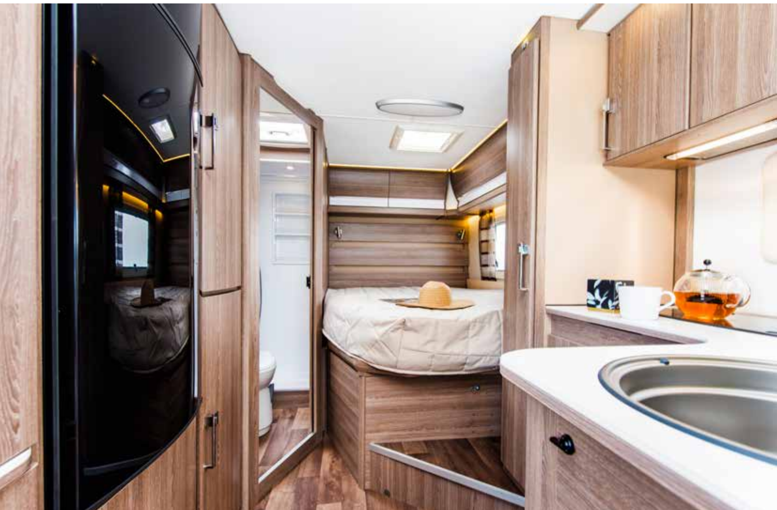
Travel Master Classic 740 LXL med dobbeltseng og praktisk vinkelkøkken