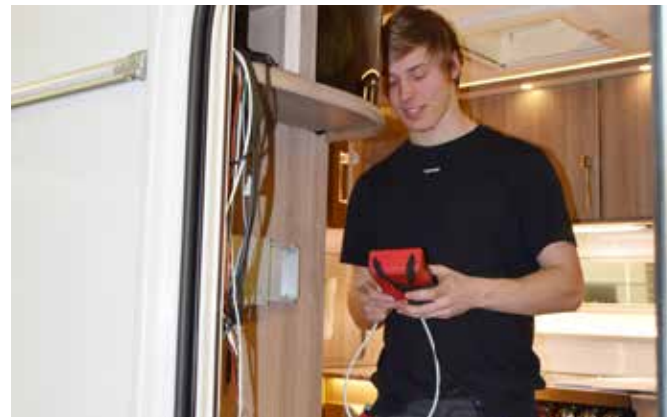
Nøyaktige funksjonskontroller, gjennomgang og rengjøring.