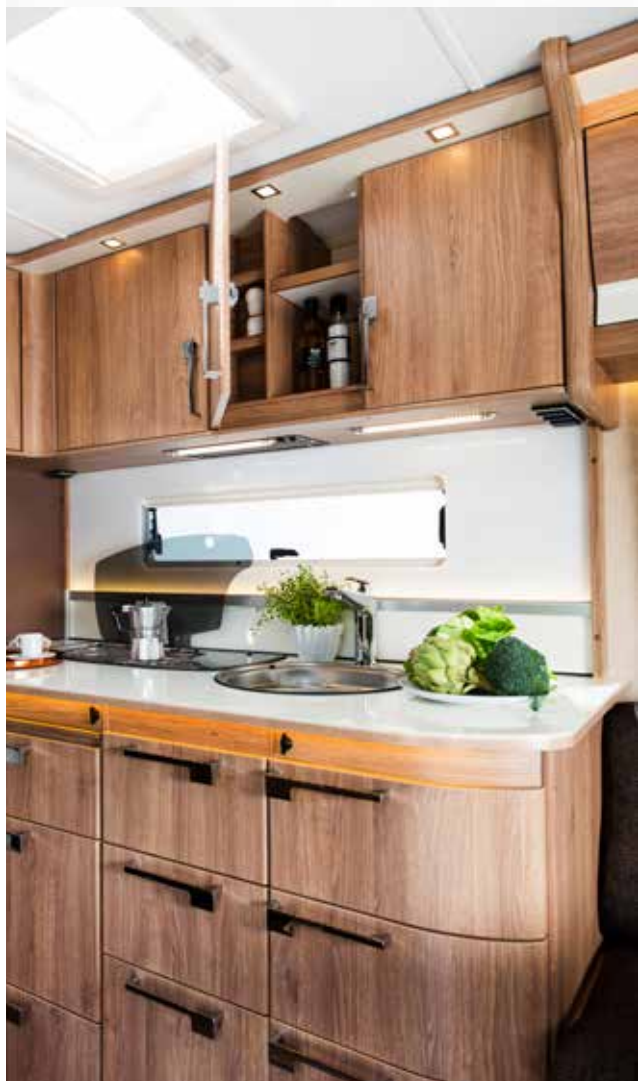
Ny treinnredning Camargue Oak på Classic og Edelsten.