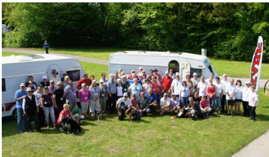
KABE Club Danmark på besøk hos KABE Club Deutschland i Bad Gandersheim. Langbord med KABE Klubb Syd.