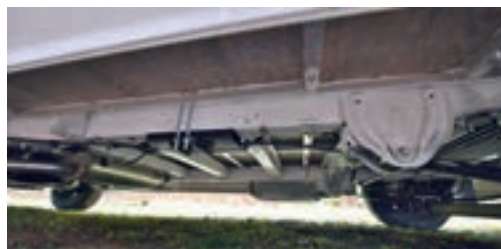
▲ En hjälpram i aluminium mellan det vita chassit och bodelens svarta undersida ger en stabil grund för bodelen. Dold kvalitet.