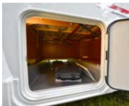
▲ Garaget är stort och lastar långa saker då utrymmet fortsätter in under badrummet. Notera: dubbla tätningar på luckan och en aluminiumprofil på tröskeln som skyddar mot islag.