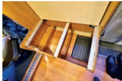
▲ En riktig hall! Garderob innanför dörren, skofack, stort fönster i dörren. Inte illa.

Garderob nr två är placerad jämte köket. Den hyser värmaren och kan dubblera som torkskåp. Vi noterar att man bemödat sig om att placera små trådkorgar för vantar och annat smått. Omtänksamt. Här är även stängen att hissa teveantennen med placerad – hög antenn är lika med bra mottagning. ▼