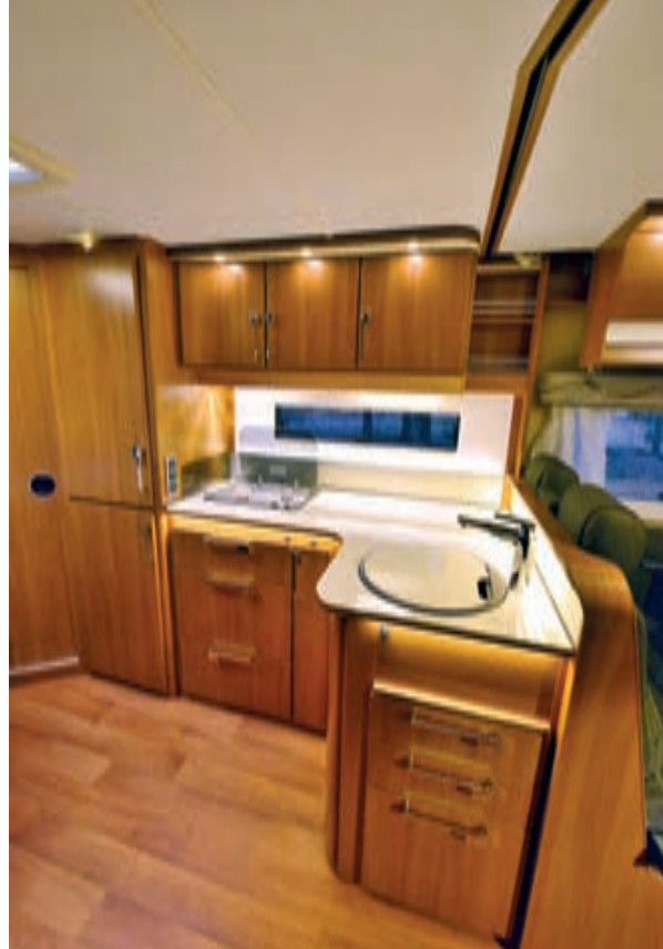
▲ Köket är köpskäl nog. Stort, välplanerat, gott om plats för torrvaror och utensilier, hög kyl. Testbilen hade kylskåp med frysfack; kyl med separat frys är alternativ. Då hamnar frysen uppe under taket för att bibehålla den höga kylan. Lådorna är självstängande och försedda med centrallås i form av ett enkelt vred.