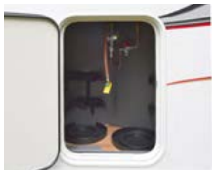
▲ Gasutrymmet lider av en för liten lucka, låg arbetshöjd och en tröskel som ska övervinnas. Kabe kan bättre, det har vi sett i de helintegrerade bilarna. Positivt är att man satt skyddslist över tröskeln. Man kommer garanterat slå i den med tung flaska.