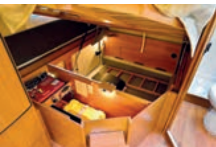
▲ Sängen lyfts och hålls uppe med två gasfjädrar. Här kommer man åt batteri, laddare, elcentral, spillvattentank och det man stuvat in i garaget.