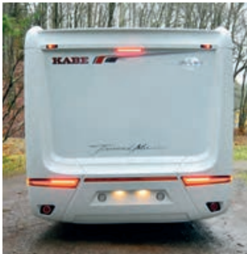
▲ Det är en rejäl bakdel. Bilen är nästan lika bred som hög.

Modell Kabe TM X740 LXL Ursprungsland Sverige Chassi Fiat + AL-KO Motor 2,3MJ 150 hk Vridmoment 350Nm Växellåda 6 växlad Totalvikt 4 250 kg Max last ca 1 160 kg (Tjänstevikten på hemsidan anges till 3 090 kg, i prislistan står 3 280 kg, vilken är korrekt?) L x B x H 740 x 249 x 308,5 centimeter Invändig höjd 198 cm Bränsletank 90 liter Vattentank 60 liter Grävattentank 90 liter Toatank 17 liter Utrustning ABS, dubbla airbags, farthållare, Traction+ antispinnssystem med hillholder, antisladdsystem, AC, centrallås (inklusive bodel), vattenburen värme, värmegolv vattenburet, värmeväxlare, motorvärmare diesel, kyl med frysack, kraftigare generator, teveantenn med förstärkare. Antal bäddar 2 + 1 + 1 Antal bältade platser 4 Grundpris 917 000 kronor Pris som testad 959 350 kronor (150 hk motor, 115Ah batteri, skinnklädsel i hytten) Handlare www.kabe.se Vi lånade bilen av Kabe i Tenhult