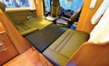
▲ Sittgruppen är enkelt bäddbar, resultatet blir hyggligt.