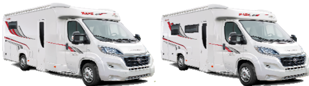
Två heta nyheter på husbilssidan – Travel Master Classic 740 LGB och Travel Master Classic 740 T.

På husbilssidan är det många som efterfrågat en rejäl och prisvärd motsvarighet till Classic-husvagnen. Därför breddar KABE sitt husbilsutbud och inför en Classic-modell även här – en mycket prisvärd husbil i Travel Master-familjen. Travel Master Classic är en instegmodell, vilket innebär lite färre tillval och en något kortare utrustningslista. Men det är KABE hela vägen.