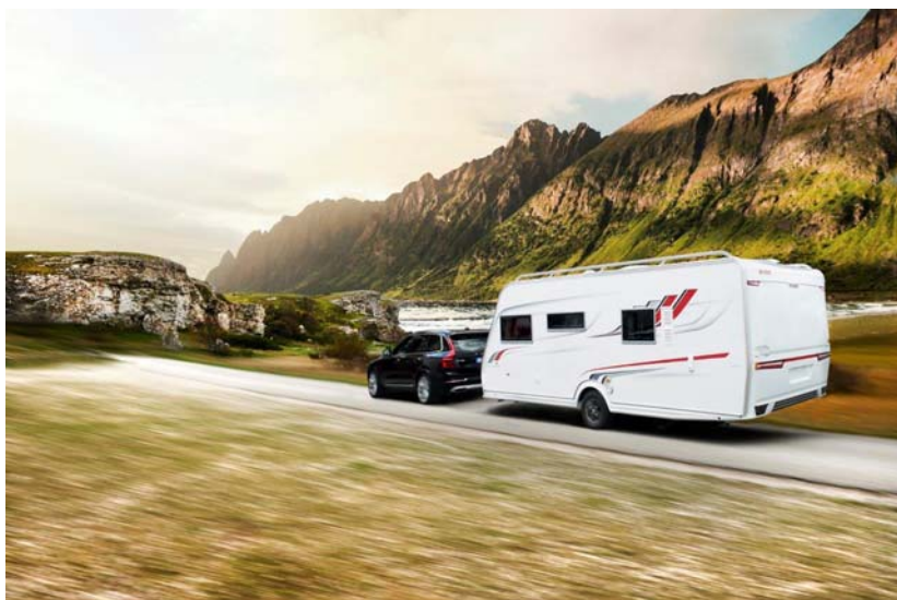
Dramatiske skyggepartier på Innovation design-platen – Imperial.

Stadig å ligge lengst fram i utviklingen av campingvogner har vært KABEs filosofi helt siden starten for mer enn 50 år siden. Til 2016 presenteres flere nyheter som bidrar til å gjøre det bekvemme KABE-livet enda mer komfortabelt. Dessuten gjennomføres noen riktig spennende designforandringer, både innvendig og utvendig.