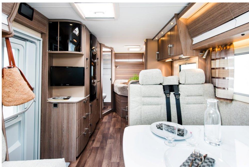
Travel Master Classic 740 LXL med dubbelseng og praktisk vinkelkøk.