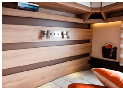
Belyst sengegavl (Classic og Edelsten)