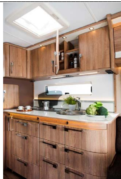
Ny treinnredning Camargue Oak på Classic og Edelsten.