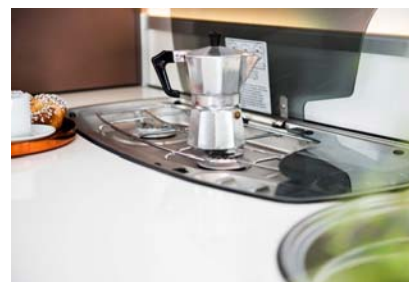
Delt lokk på den 3-bluss komfyren