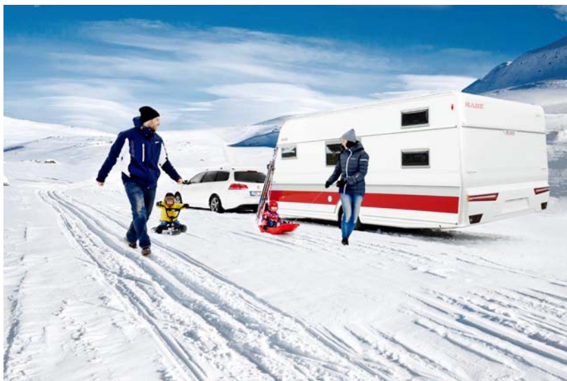
Nye, tøffe, helt egenutviklede lamper – nå også på Classic

- Vi har også gjort en forbedring av vår såkalte Grand Lit-løsning, den ekstra store sengen som skapes mellom to enkeltsenger. Den er nå utstyrt med en uttrekkbar sengeedel som utgår fra sengebordet, forklarer Mikael Blomqvist.