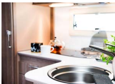
Fondvegg i kjøkkenet