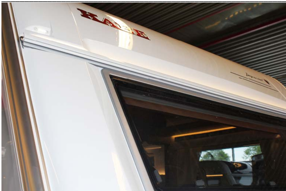
Effektfull belysning i drypprofilen foran – standard på Imperial.