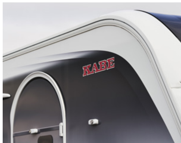
Ny dekor på den glatte veggplaten med stilrene linjer og sobre mørke toner.

KABEs unike verdier inngår uansett hvilken modell som passer best for deg og din familie.