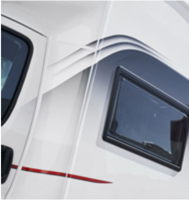
Oppdatert design på veggplate.