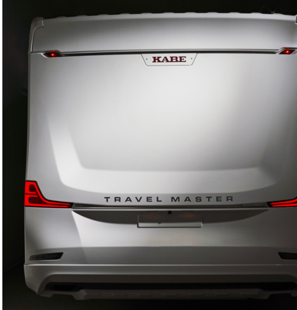
Ny bakende på halvintegreerte Royal-bobiler