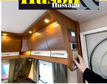
PANEL. Manöverpanelerna är samlade vid entrén och nås inte av småbarnen.