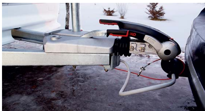
INGÅR. Säkerhetskoppling som kniper om dragkroken ger stadigare färd. Al-Ko:s antisladdsystem AKS är däremot tillval.

” Räknar vi ihop alla garderober och överskåp är det imponerande mycket förvaringsutrymmen.