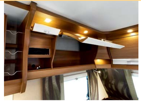
NYHET. Överskåpen med tvåfärgade luckor är nya till 2014. Snyggt och stabilt!