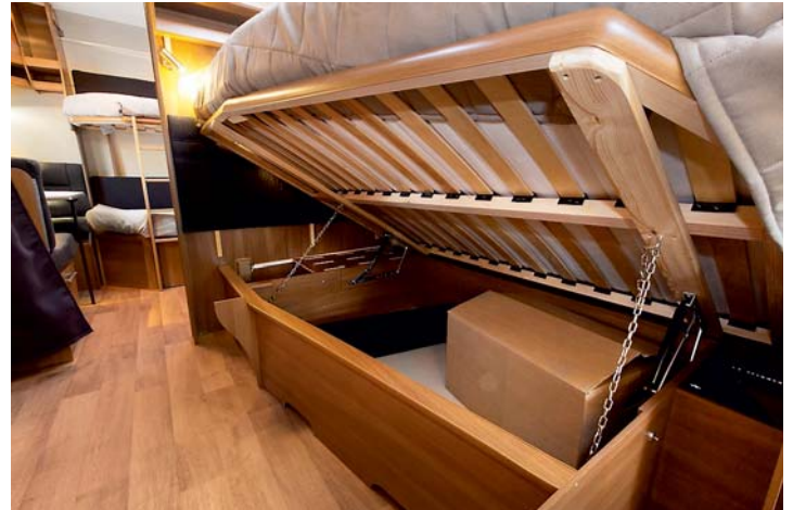
SPRÄTTIG. Även ett barn kan hantera bädden för hjälpfjädrarna till sängen var så starka att de nästan sprätte iväg sängkläderna.

färd med tre små vred, ett för varje lådrad.