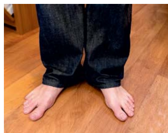
FOTAD. Det är härligt med vattenburen golvvärme!