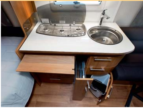
KOMPAKT. Köksbänken är inte stor men ändå ganska bra avställningsytor.