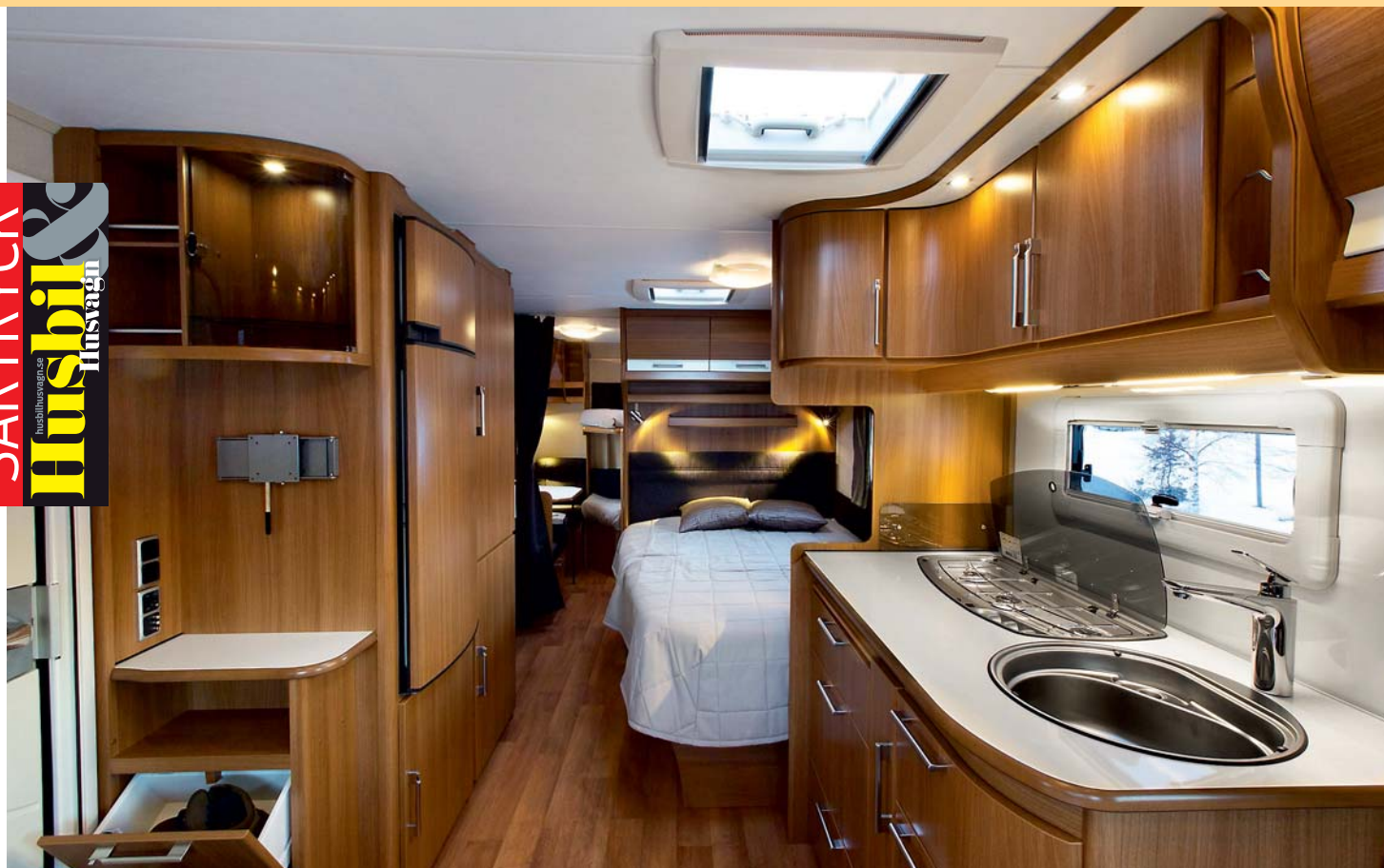
LÅNG. Känslan av rymlighet är påfallande. En lång och bred korridor ger en öppen känsla. Längst bort syns barnkammaren.