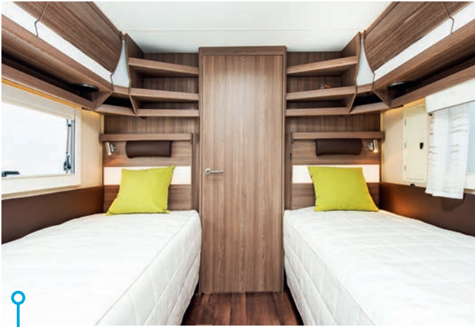
Planlösning med långbäddar och vagnsbrett hygienutrymme bak. Justerbar huvudända på sängarna är en bonus.