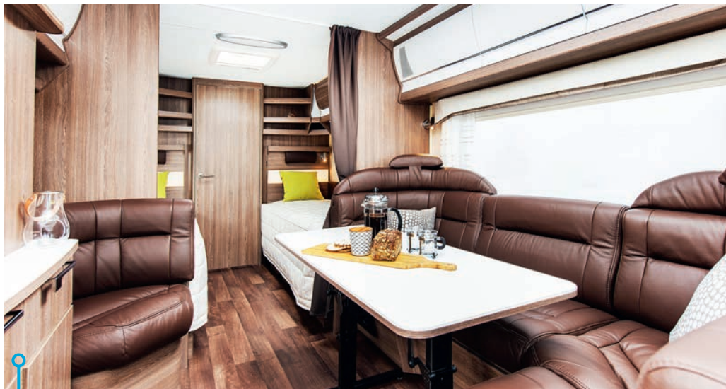
Den här sittgruppen är en riktig tiopoängare. Här finns kvalitet och komfort i kubik.