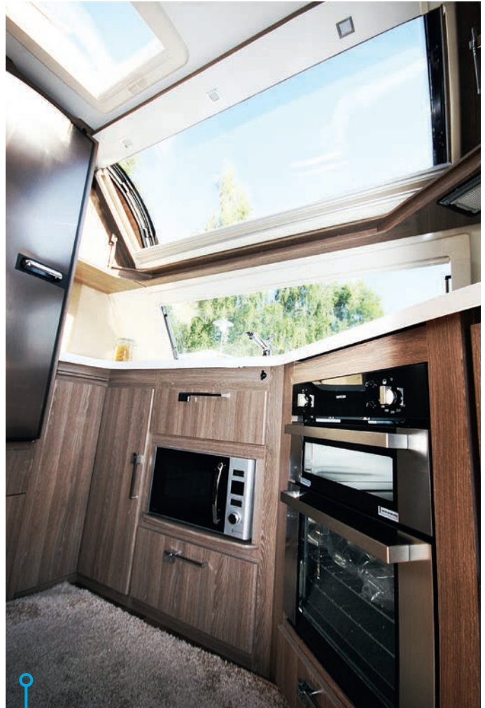
Öppen och ljus känsla i köksavdelningen där utrustningsnivån är hög med induktionshäll, ugn, grill, mikrovågsugn och 190-liters kyl.

som inte alltid är synliga för ögat men som i allra högsta grad bidrar till kvalitetsboende: energifönster med polyuretantankarm, egenutvecklat patentsökt automatiskt vattenburet värmesystem (AGS II) med fyra slingor och värmeplåtar som fördelar värmen, integrerat värmesystem där golvvärmesystem är ihopkopplad med konvektorerna, intervallstyrt värmesystem med shuntventil, dubbla temperaturgivare, patenterat ventilationssystem (VarioVent), fria luftströmmar från golv, bakom skåp, under sängar/soffor och de ventilerade överskåpen, belastningsvakt, skidlåda, vinklade kabelrännor för att ge luftströmmarna fri passage, soffor och sängar som står på distanser, torkskåp med droppfat samt Smart D Remote – en app varifrån husvagnens system kan styras via mobiltelefonen. Det-