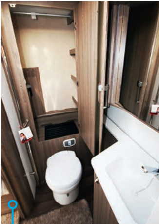
Garderob/linneförråd finns bakom toasitsen.