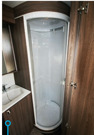
Rymlig och stabil dusch-kabin med takventil.