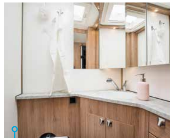
Rymligt hygienutrymme i 600 GLE.