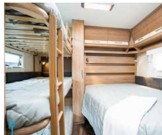
Tryggt för de allra yngsta att sova nära mamma och pappa.