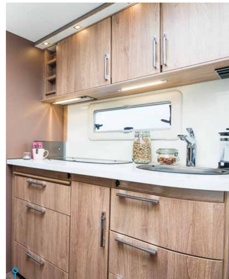
En köksavdelning med allt som behövs och som passar en barnfamilj.