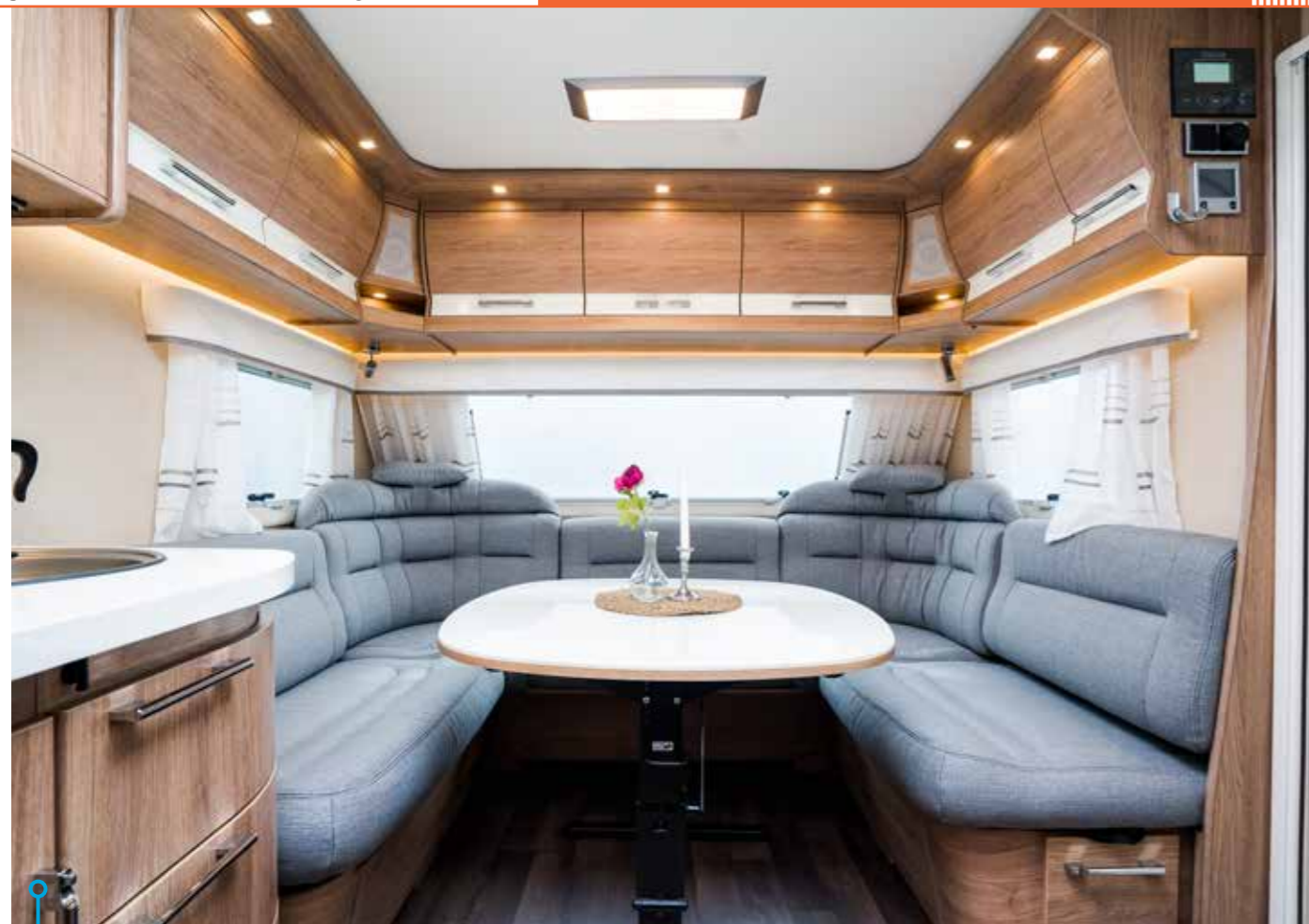
Sittgruppen är lika skön som hemma och dessutom sväljer den en stor familj.