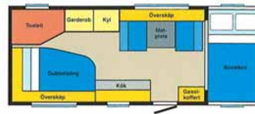
TRAVEL MASTER 570 X2

Sovutrymme bak X2 / A1: 190 x 129 cm / 208 x 125 cm Sovutrymme dinette / alkov: 187 x 100 cm / 215 x 135 cm