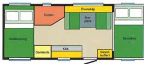
TRAVEL MASTER 570 A1

Sovutrymme bak XV1 / XV2: 135 x 215 cm / 190 x 129 cm