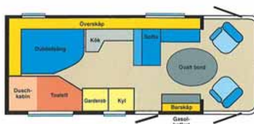
TRAVEL MASTER HI XV2

Sovutrymme bak XV1 / XV2: 135 x 215 cm / 190 x 129 cm