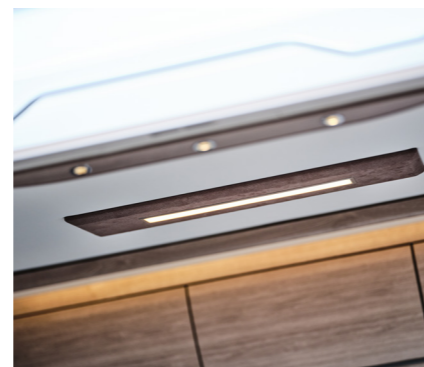
Nieuw ontworpen plafondlampen en lichtbalken.

Nieuw voor 2022 is dat de Van leverbaar is met dubbele wielen, waardoor het laadgewicht wordt verhoogd met ca 850 kilo en het toegestane combinatiegewicht nu 7000 kilo bedraagt. Ideaal voor iedereen die een paardentrailer wil trekken of zware werkuitrusting of bijvoorbeeld een boot op een trailer.