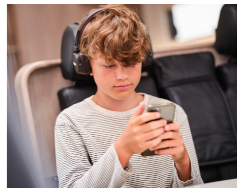
Nieuwe constructie van de dinettebank, die voorkomt dat het kussen van de bank wegglijdt waardoor de passagier onder de veiligheidsgordel kan glijden bij een eventuele aanrijding.

Kwaliteit. Techniek. Keuzevrijheid. Functionaliteit. Veiligheid.