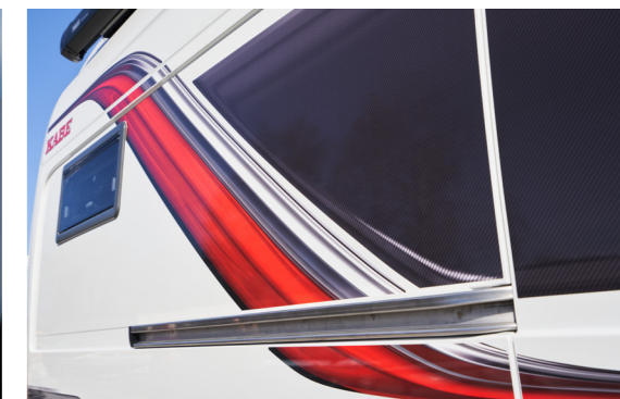
De standaardkleur van de Van is wit, met wit front en witte bumper. Als optie is de Van in grijsmetallisch leverbaar.