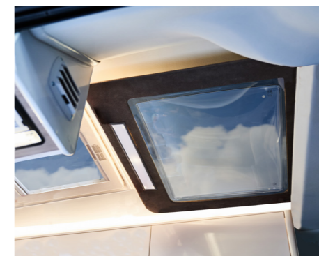
KABE Van -mallissa on tilantuntua lisäävä panoraamakattoikkuna.