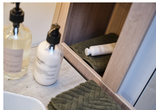
Uusi betonipintaa jäljittelevä laminaatti.

Laatu. Tekniikka. Valinnanvapaus. Toimivuus. Turvallisuus.