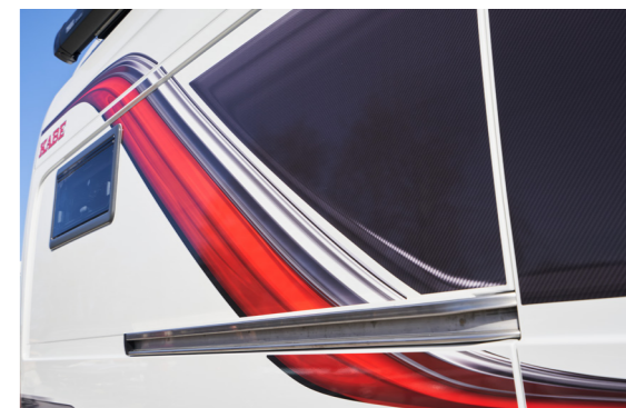
Valkoisesta Van-mallista, jossa on valkoinen etuosa/puskuri, tulee vakiovaruste. Valinnaisena värinä metallinharmaa. KABE NR 1 2022 9