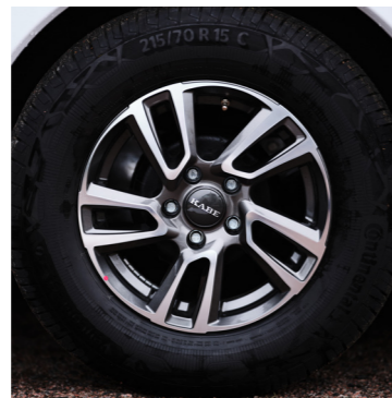
Nye smarte 15" fælge.