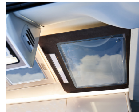
For at øge følelsen af plads inden i KABE's Van er der et panoramavindue i taget.