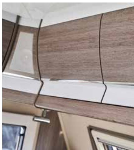
Overskapsluker, kromlist, Shannon Oak. (Edelsten foran/bak. Royal bak. Tilvalg Royal foran). Høyblanka (Imperial foran/bak).