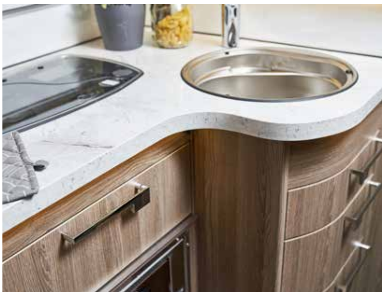
Innfelte luker og skuffer.