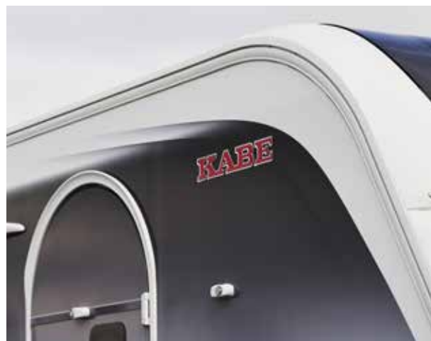
Ny dekor på den glatte veggplaten med stilrene linjer og sobre mørke toner.

KABEs unike verdier inngår uansett hvilken modell som passer best for deg og din familie.