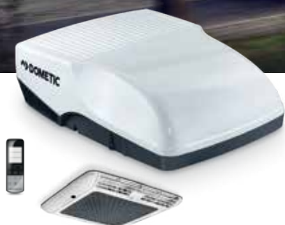
DOMETIC FRESHJET 2200