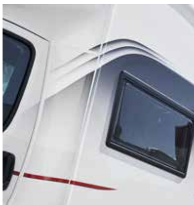
Oppdatert design på veggplate.