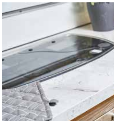
Laminat "marmor" i arbeidsbenk.

KABEs unike verdier inngår uansett hvilken modell som passer best for deg og din familie.