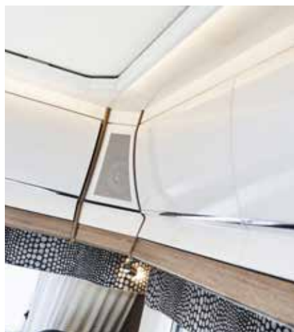
Overskapsluker, hvite høyblanke. (Royal foran. Tilvalg Imperial foran.)