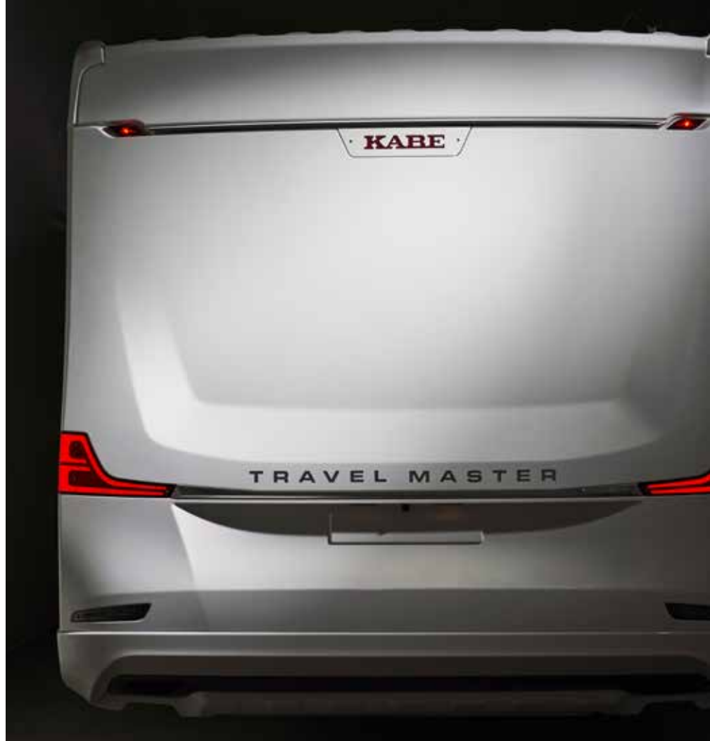
Ny bakende på halvintegreerte Royal-bobiler