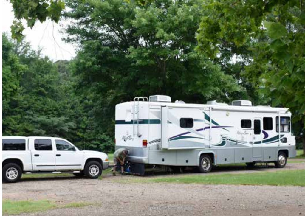
Typiskt USA-ekipage, med bilen på släp.

Vi hyrde en husbil från Cruise America, som är ett stort företag med 118 uthyrningsställen i USA, Canada och Alaska. Bokningen gjorde vi hemifrån, via företagets hemsida. Precis som när man hyr en vanlig personbil påverkas priset av fordonets storlek, körsträckan och var man hämtar och lämnar.