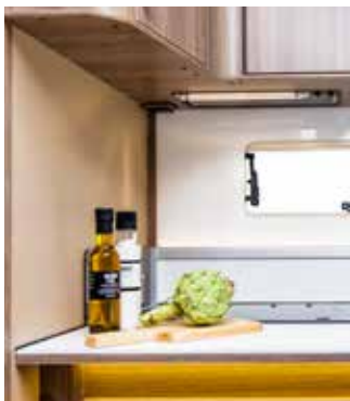
Fondvägg i köket.