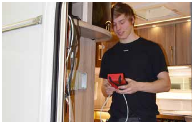
Noggranna funktionskontroller, avsyning och städning.