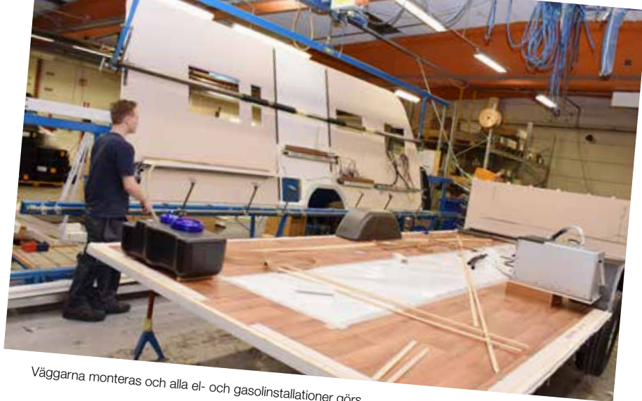
Väggarna monteras och alla el- och gasolininstallationer görs.

Varje dag lämnar cirka 7 husvagnar KABE-fabriken i Tenhult. Drygt 1400 vagnar per år levereras till köpare i hela Norden samt Tyskland och Holland.