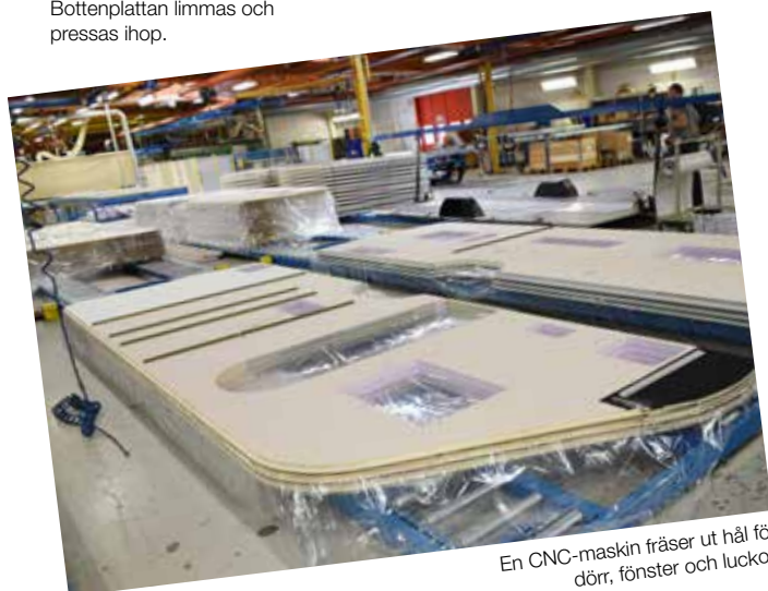
En CNC-maskin fräser ut hål för dörr, fönster och luckor.