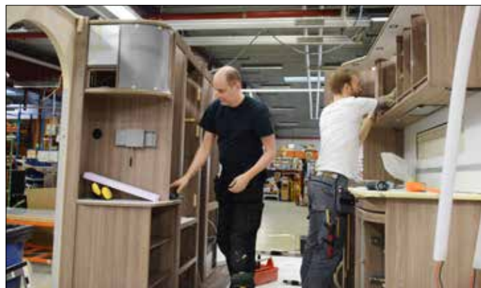
Inredningen byggs i färdiga moduler.