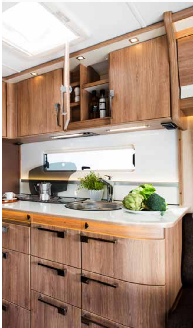
Ny träinredning Camargue Oak på Classic och Ädelsten.