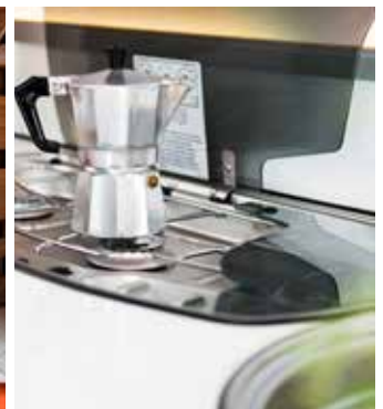
Delat lock på den 3-lägiga spisen.

- Vi har också gjort en förbättring av vår så kallade Grand Lit-lösning, den extra stora sängen som skapas mellan två enkelsängar. Den är nu utrustad med en utdragbar sängdel som utgår från sängbordet, förklarar Mikael Blomqvist.