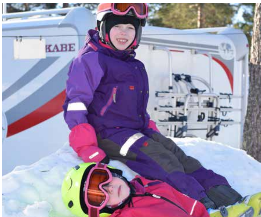
I väntan på skidskolan.

Dagarna är längre och vårsolen har börjat värma. Det är mitten av mars, men ännu återstår flera veckor med härlig skidåkning och avslappnat vinterliv i husvagnar och husbilar på campingen i Tandådalen.